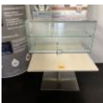
Table basse plateau stratifié façon bois Petite vitrine Mise à prix : 20€

Photocopieur HP L3U51A numéro de série CNDVK2P0KV Mise à prix : 80€