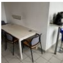
Table plateau stratifié façon bois 4 Chaises visiteur Tabouret haut Micro-ondes KING D'HOME Cafetière PHILIPS Cafetière SENSEO Bouilloire électrique Mise à prix : 80€

Bureau piètement tubulaire chrome 2 Fauteuils skaï noir Armoire stratifié façon bois Mise à prix : 70€