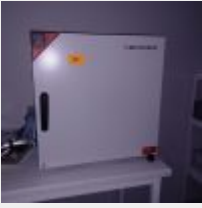
Lot n° 66 Etuve BINDER EDS056 2019 Mise à prix : 300€