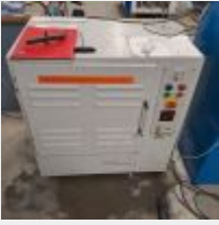
Lot n° 54 Tribo finition BREDDENT POLIERJET QUADRO FINISH FT4/10, 1999 Mise à prix : 200€