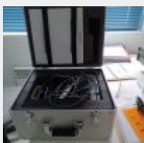
Lot n° 78 Micro moteur COXO M1306 Mise à prix : 400€