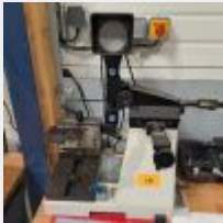
Lot n° 10 Barre de pré réglage d'outils TORNOS Mise à prix : 200€