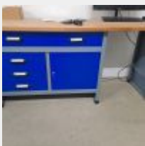
Lot n° 34 4 Etablis métal bleus (3 modèles différents) Armoire hauteur d'appui 3 Tables bureaux 2 Chaises dactylo PC fixer tour ZALMANN double écran PC fixe tour DELL écran DELL Desserte Mise à prix : 500€