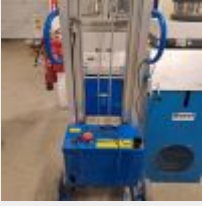
Lot n° 49 Petit élévateur électrique NOVON, modèle ML 130 150, 2021 Mise à prix : 200€