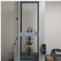
Lot n° 33 Machine essai de traction, compression 50KN SHIMADZU AGS-X, 2019, achetée 36 600€TTC Avec PC fixe tour LENOVO écran SAMSUNG Mise à prix : 5000€ Vendu par la SVV ADJUGE, Frais de vente : 20%HT