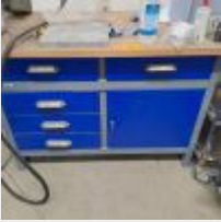
Lot n° 55 2 Etablis métal bleu 6 Etagères métal bleu Plonge inox (obligation de mettre des bouchons aux arrivées d'eau) 3 Chaises sur roulettes 2 Escabeaux Desserte 2 Servantes Mise à prix : 350€