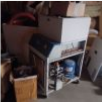
Lot n° 56 Tondeuse thermique Enrouleur de tuyau d'arrossage Pièces de machine Mise à prix : 50€