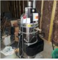
Lot n° 48 Aspirateur triphasé SLM solutions GMBH AMC 330 Mise à prix : 1500€