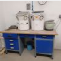
Lot n° 58 2 Petits sableurs automatiques RENFERT VARIO JET, aspirateur KARCHER (derrière le mur) Etabli métal bleu Mise à prix : 400€