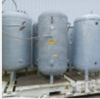
Lot n° 74 5 Cuves galva (4 de 1500L et 1 de 2000L) pour stockage Azote (3 en exploitation dont 1 pour l'air comprimé) Mise à prix : 600€