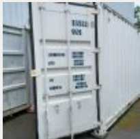
Lot n° 76 Conteneur 20 pieds Mise à prix : 1200€