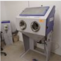
Lot n° 57 Sableuse FORMULA 1400 GUYSON avec aspirateur GUYSON n°507880, 20/3 + Caisson rouge d'aspiration Mise à prix : 300€