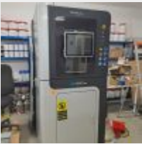
Lot n° 51 Machine Fusion laser TECHGINE E TS 120, 2019, INS 103 Financement 198 000 euros en 2019 Mise à prix : à confirmer Vendu par la SVV ADJUGE, frais de vente : 20%HT