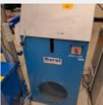
Lot n° 53 Refroidisseur d'air BOREL RE 100 1, INS109, S12141 Mise à prix : 500€