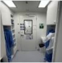
Lot n° 68 Conteneur salle blanche, 2013, contenant avec un sas d'entrée et système de ventilation 2 Blocs DAIKIN ERQ140A7V1B (2013) A décabler en mettant le système électrique en sécurité Acheté d'occasion en 10/2019 : 175 000€TTC Mise à prix : 35 000€