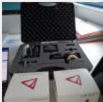
Lot n° 77 Scanner 3 shape D 90 2014, 50 800€TTC + PC fixe Mise à prix : 6000€