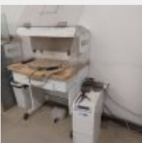
Lot n° 59 2 Box avec établi, pièces à mains (type DREMEL) avec 1 aspirateur RENFERT Box, pièce à main Mise à prix : 350€