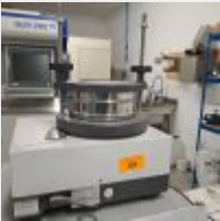
Lot n° 52 Machine de tamisage manuel RETSCH AS 200 Basic, , 2015, 3400€TTC Mise à prix : 400€