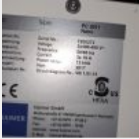
Lot n° 9 Banc de frettage HAIMER (11 453€TTC), 2017 Mise à prix : 2000€