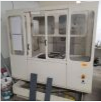
Lot n° 50 Usineuse REALMECA C300H, problème de bras (non fonctionnel), le pneumatique et l'électrique fonctionne, payée 4500 euros Mise à prix : 600€