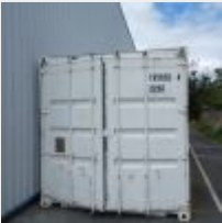
Lot n° 71 Conteneur 20 pieds Mise à prix : 1200€