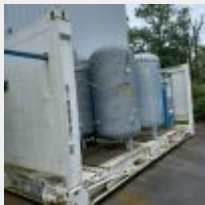
Lot n° 75 Conteneur 20 pieds FLAT RACK acheté en 2015 Mise à prix : 1200€