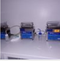
Lot n° 67 3 Bains à ultra son BPAC 3 Tables de travail rectangulaires blanches 2 Etagères Mise à prix : 250€