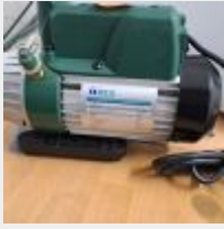
Lot n° 29 Pompe IREX RX1S Mise à prix : 50€