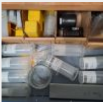
Lot n° 11.1 2 Etablis métal bleu ouvrant à 2 portes et 6 tiroirs Mise à prix : 200€