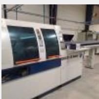
Lot n° 12 Décolleteuse TORNOS DECO 13 basic, DECO 1.INS005 (2001, achetée d'occasion en 2016 : 92 842€TTC Obligation de mettre en sécurité le système électrique au moment du démontage Prévoir la vidange des 200L d'huile de coupe avant le transport Mise à prix : 10 000€