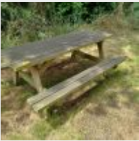
Lot n° 69 Table de picnic Mise à prix : 50€