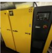
Lot n° 72 Compresseur KAESER ASD50 SFC et assécheur DC 75, fin 2019 Acheté en 2020, 35 024€47TTC Mise à prix : 6 000€ Vendu par la SVV ADJUGE, frais de vente : 20%HT