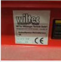
Lot n° 8 Presse WILTEC 12 Tonnes Mise à prix : 150€