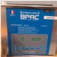
Lot n° 11 2 Bacs ultrason BPAC Mise à prix : 40€