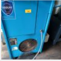
Lot n° 73 Compresseur KOPRESSOR, 2014 Mise à prix : 3000€