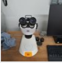
Lot n° 30 Binoculaire ZEISS (2500 euros) Mise à prix : 400€