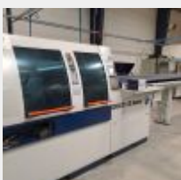
Lot n° 12 Décolleteuse TORNOS DECO 13 basic, DECO 1.INS005 (2001, achetée d'occasion en 2016 : 92 842€TTC Obligation de mettre en sécurité le système électrique au moment du démontage Prévoir la vidange des 200L d'huile de coupe avant le transport Mise à prix : 10 000€