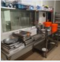
Lot n° 48 1 Table inox avec entrejambe et surmonter d'une étagère 280x70 cm Mise à prix : 200 €