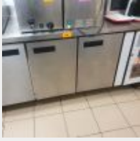
Lot n° 49 Tour réfrigéré HS Mise à prix :150 €