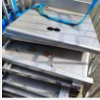
Lot n° 80 Bar des champs libres inox, évier bac à cocktails, modules bar inox Mise à prix : 320 €