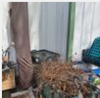
Lot n° 83 Ensemble comprenant 3 Chariots et 2 Parasols sur pied Mise à prix : 50 €