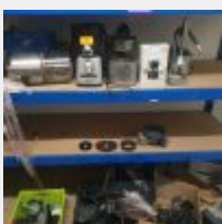
Lot n° 29 Ensemble comprenant 2 Centrifugeurs presse agrumes MAGIMIX, 1 Café RICHARD, 1 MAGIMIX (sans bol) et 1 Chariot. Etat moyen Mise à prix : 100 €