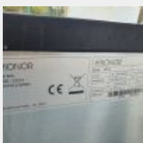
Lot n° 84 Vitrine réfrigérée 3 portes groupe intégré FRIONER (leds HS) Mise à prix : 200 €