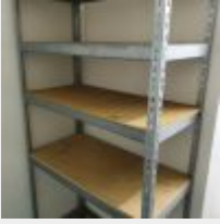
Lot n° 71 4 Étagères sur cornières Mise à prix : 150 €