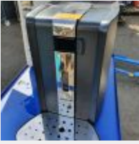
Lot n° 70.2 1 Tireuse à bière PHILIPS Mise à prix : 50 €