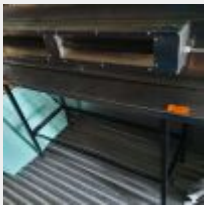
Lot n° 89 1 Table inox sur pied métal Mise à prix : 80 €