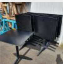
Lot n° 74.1 10 Tables carrées piètement métal tripode Pedrali Mise à prix : 450 €