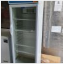
Lot n° 87 Vitrine réfrigérée FRIGELUX Mise à prix : 40 €