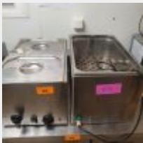
Lot n° 64 2 Bains maries METRO GBM1200 et GUSTOCHEF PACOCLEAN (bain marie avec contrôle température) Mise à prix : 150 €