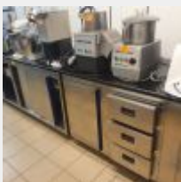
Lot n° 52 Meuble inox dessus marbre noir en 2 parties 5 portes 3 tiroirs (ancien tour réfrigéré utilisé en meuble neutre) Mise à prix : 300 €