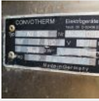
Lot n° 85 Four CONVOTHERM inox pour remise en température Mise à prix : 150 €