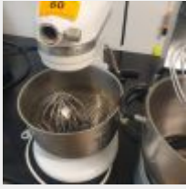
Lot n° 60 1 Robot pâtisserie KITCHENAID avec 1 Cuve et 2 Fouets Mise à prix : 80 €