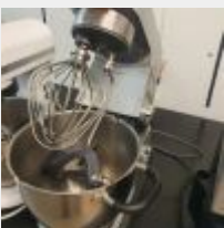
Lot n° 59 Robot KENWOOD avec 1 Cuve, 1 Fouet et Accessoires Mise à prix : 40 €