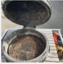
Lot n° 79 Barbecue MONOLITH et desserte Mise à prix : 500 €