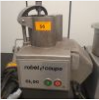
Lot n° 56 Robot coupe CL50 avec Accessoires Fonctionne Mise à prix : 140 €