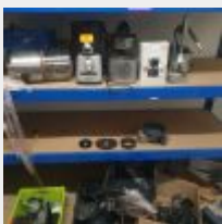
Lot n° 29 Ensemble comprenant 2 Centrifugeurs presse agrumes MAGIMIX, 1 Café RICHARD, 1 MAGIMIX (sans bol) et 1 Chariot. Etat moyen Mise à prix : 100 €