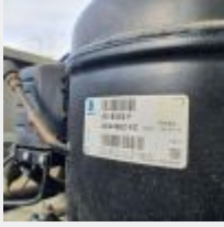
Lot n° 86 Armoire réfrigérée inox 2 portes reconditionnée en 2017 avec groupe froid neuf Mise à prix : 400 €