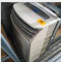
Lot n° 90 Climatisation mobile réversible HEATCOOL Mise à prix : 20 €