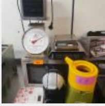
Lot n° 61 Ensemble comprenant 1 Machine à café DOLCE GUSTO, 1 Presse jus SANTOS, 1 Four micro-ondes SHARP, 1 Balance MAFER, 3 Balances TERRAILLON et 1 Petite chauffage boulanger Mise à prix : 200 €