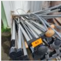
Lot n° 82 Ensemble comprenant 1 Chariot bleu 3 niveaux, Grilles, 1 Etagère métal bleu, 3 Chariots sur roulettes et 1 Plancha (état ?) Mise à prix : 120 €