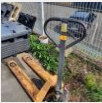
Lot n° 73 Transpalette (corrosion) Mise à prix : 100 €