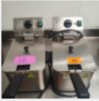
Lot n° 66 2 Friteuses HORECA Fonctionne Mise à prix : 100 €