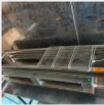
Lot n° 88 Passe à étagère chaud ENODIS Mise à prix : 200 €