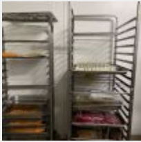
Lot n° 26 Ensemble de 5 Échelles, 107 Grilles et 4 Plaques de cuisson. Mise à prix : 400 €