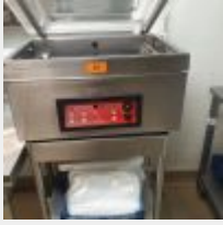
Lot n° 25 Machine pour sous vide PACOCLEAN sur table inox sur roulettes (1079.10€HT) 10/2017 Mise à prix : 400 €