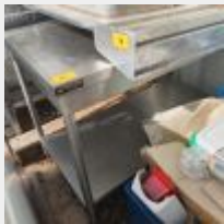
Lot n° 81 1 Table inox Mise à prix : 100 €