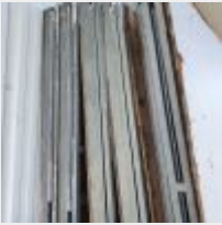
Lot n° 72 6 Buffets traiteur, pieds amovibles, Tente 2 travées et 2 Tables pliantes (dont une cassée) Mise à prix : 300 €