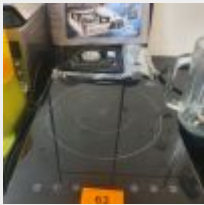
Lot n° 63 Plaque à induction HENDI et 1 Plaque à gaz KEMPER Neuve Mise à prix : 200 €