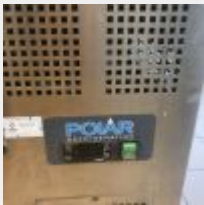
Lot n° 50 Tour réfrigéré HS Mise à prix :150 €