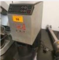
Lot n° 58 Turbine PACOCLEAN II avec 1 Bols et Accessoires (couteaux) (environ 4257€HT), 10/2017 Mise à prix : 100 €