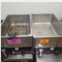
Lot n° 65 2 Bains marie ARTIS Mise à prix : 150 €