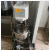
Lot n° 69 Batteur HMI THIDORE avec Accessoires, s'allume mais problème de mise en route car variateur HS Mise à prix : 100 €