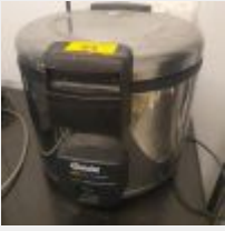
Lot n° 54 Auto-Cuisseur BARTSCHER Mise à prix : 50 €