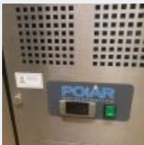
Lot n° 51 Tour réfrigéré HS Mise à prix :150 €