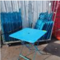
Lot n° 74 29 Tables pliantes bleues métal sur 2 Chariots Mise à prix : 600 €