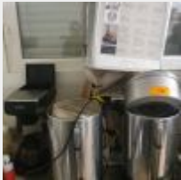
Lot n° 70 4 Réchaud à café inox WESTBEND Mise à prix : 80 €