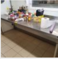
Lot n° 24 Table inox 240x80 cm avec doseret Mise à prix : 80 €