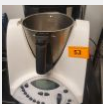
Lot n° 53 Thermomix VORWERK Mise à prix : 100 €