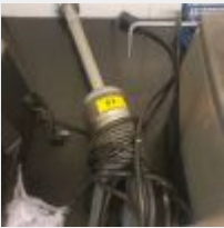
Lot n° 57 Robot coupe MP 450 Mise à prix : 150 €