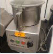
Lot n° 55 Robot coupe BLIXER 5 plus Etat moyen Mise à prix : 200 €