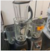
Lot n° 62 Ensemble de 3 Blenders, 1 MOULINEX PerfectMix+, 1 Mixeur MOULINEX et 1 Mixeur SANTOS Mise à prix : 100 €