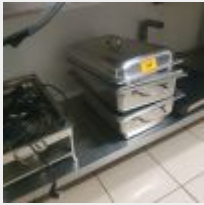
Lot n° 68 Ensemble de 6 Bacs gastro maintien au chaud avec couvercles et bruleurs électriques, 1 Grill électrique RIVERA et 1 Presse agrume KENWOOD Mise à prix : 150 €