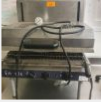
Lot n° 67 1 Salamandre ENAUDIS inox, câble d'alimentation coupé (à reconnecter) Mise à prix : 80 €