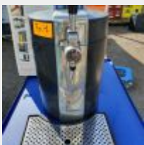
Lot n° 70.1 2 Tireuses à bière KRUPS Mise à prix : 100 €