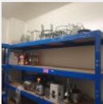
Lot n° 28 Ensemble comprenant 3 Racks métal bleu charges légères, 1 Marche pied, 9 Bocaux en verres, 1 Pot de lait en inox, Gobelets en carton et 1 Stock d'environ 40 Sirop MONIN entamés mais également 4 Bouteilles de Rosé, 2 Bouteilles d'Amareto, 2 Bouteilles de jus de fruit et 18 Bouteilles d'alcool entamés. Mise à prix : 200 €