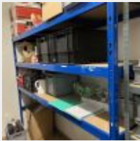
Lot n° 27 Ensemble de 4 Racks métal bleu charges légères, 1 Etagère sur cornières, 1 Vases en verre, 1 Allonge sur enrouleur, 1 Fauteuil, 1 Photocopieur, 1 Plastifieur FELLOWES, 1 Dymo BROTHER, 1 PlanchaGrill CUISINART, 1 Carage d'eau, Gobelets en carton, 1 Machine à café RICHARD (Etat ?), 2 Micro-ondes, Bassines en zinc, Plateaux inox fruit de mer, Seaux à champagne, Décoration de Noël, 1 Escabeau, Paniers en osier et 1 Caisse PVC Mise à prix : 500 €