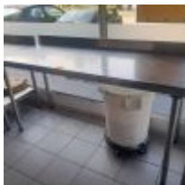
Table de travail en inox avec étagère en entrejambe L : 200cm Mise à prix : 70€