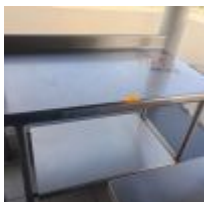
Table de travail en inox avec étagère en entrejambe L : 180cm Mise à prix : 70€