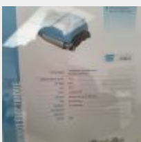
Lot n° 36 Robot FLOWBOT Flashtop électrique Neuf (PV 822,00 € TTC) Mise à prix : 150 €