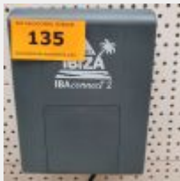
Lot n° 135 Coffret domotique IBACONNECT2 (PV 880 € TTC) Mise à prix : 200 €