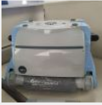
Lot n° 37 Robot FLOWBOT Flashtop électrique Neuf (PV 822,00 € TTC) Mise à prix : 150 €