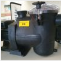
Lot n° 99 Pompe IBABUMP 0,75 CV (PV 441 € TTC) Mise à prix : 100 €