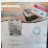
Lot n° 18 SPA ABSOLUTE 3 Places dont 2 allongées (210x150x81) Neuf (PV 6990,00 € TTC) Mise à prix : 1500 € Attention : Il faut prévoir le démontage et remontage des portes du magasin pour sortir ce lot. L'étude prend la responsabilité de cette opération le jour de l'enlèvement le 11/04 à 9h30. Enlèvement impératif uniquement le 11/04 à 9h30.