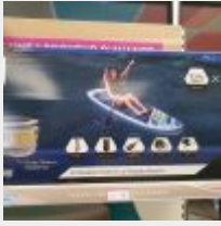
Lot n° 13 Paddle Bleu BESTWAY 305x84 cm (PV 325,00 € TTC) Mise à prix : 80 €