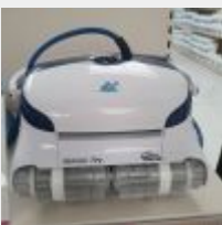
Lot n° 30 Robot IBAVAC PRO électrique Neuf (PV 1595,00 € TTC) Mise à prix : 350 €