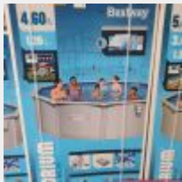
Lot n° 5 Piscine Hors Sol BESTWAY HYDRIUM Ronde (460 x 120 cm) neuve (PV 1015,00 € TTC) Mise à prix : 250 €