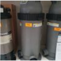
Lot n° 111 Filtre à cartouche ZODIAC CS100 (PV 698 € TTC) Mise à prix : 200 €