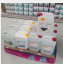
Lot n° 138 Ensemble de produits de traitement de l'eau comprenant PH moins, PH plus, Chlore, Algue verte, Pastilles de Chlore, Choc, Brome, Anticalcaire, récupérateur d'eau, anti-algues, nettoyant filtre... Bidons de PH moins, Chlore et PH plus (PV de l'ensemble environ 5000 € TTC) Mise à prix : 1500 €