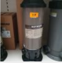
Lot n° 110 Filtre à cartouche STARCLEAR SC 11 m3/h (PV 615 € TTC) Mise à prix : 200 €