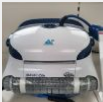
Lot n° 35 Robot IBAVAC ZEN électrique Neuf (PV 1150,00 € TTC) Mise à prix : 250 €