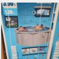
Lot n° 6 Piscine Hors Sol BESTWAY HYDRIUM Ronde (300 x 120 cm) neuve (PV 763,00 € TTC) Mise à prix : 200 €