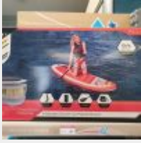
Lot n° 14 Paddle Orange BESTWAY 274x76 cm (PV 267,00 € TTC) Mise à prix : 50 €