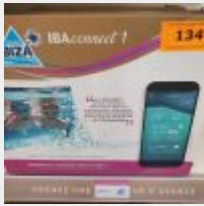
Lot n° 134 Coffret domotique IBACONNECT1 (PV 400 € TTC) Mise à prix : 100 €