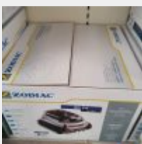
Lot n° 42 Robot ZODIAC 20XA IQ électrique Neuf (PV 960,00 € TTC) Mise à prix : 200 €