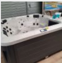
Lot n° 16 SPA ICONIC 5 Places dont 1 allongée (228x228x97) gamme URBAN Neuf (PV 8990,00 € TTC) Mise à prix : 2000 € Attention : Il faut prévoir le démontage et remontage des portes du magasin pour sortir ce lot. L'étude prend la responsabilité de cette opération le jour de l'enlèvement le 11/04 à 9h30. Enlèvement impératif uniquement le 11/04 à 9h30.