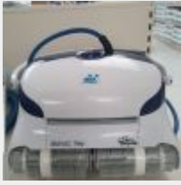
Lot n° 31 Robot IBAVAC PRO électrique Neuf (PV 1595,00 € TTC) Mise à prix : 350 €