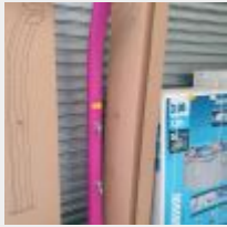
Lot n° 3 Douche Happy One Solaire Standard Rose Fushia (PV 267,00 € TTC) Mise à prix : 50 €