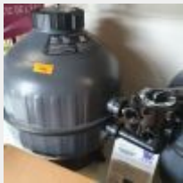
Lot n° 101 Filtre à sable IBAFILTRE D600 Side (PV 567 € TTC) Mise à prix : 100 €