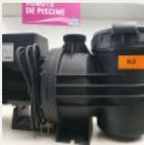
Lot n° 93 Pompe GEMFLOW à vitesse variable VS 2CV (PV 845 € TTC) Mise à prix : 250 €