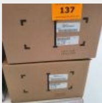
Lot n° 137 3 Régulateurs de PH NKPH (PV 216 € TTC) Mise à prix : 150 €