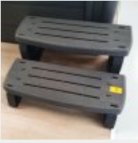
Lot n° 25 Marche de SPA (PV 125,00 € TTC) Mise à prix : 30 €