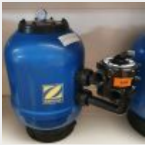
Lot n° 106 Filtre à sable ZODIAC 470 (PV 528 € TTC) Mise à prix : 100 €