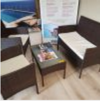
Lot n° 26 Salon de jardin comprenant 1 Canapé, 2 Fauteuils, 1 Table basse Mise à prix : 20 €