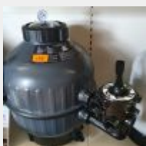
Lot n° 102 Filtre à sable IBAFILTRE D500 Side (PV 517 € TTC) Mise à prix : 100 €