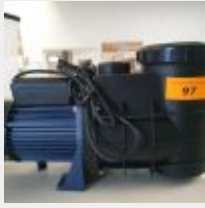
Lot n° 97 Pompe BERLING 0.75CV Mono (PV 219 € TTC) Mise à prix : 50 €