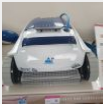
Lot n° 33 Robot IBAVAC FUN électrique Neuf (PV 999,00 € TTC) Mise à prix : 200 €