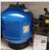
Lot n° 108 Filtre à sable ZODIAC 650 (PV 887 € TTC) Mise à prix : 250 €