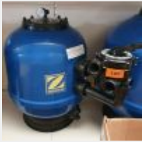
Lot n° 107 Filtre à sable ZODIAC 530 (PV 814 € TTC) Mise à prix : 200 €