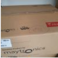
Lot n° 32 Robot IBAVAC FUN électrique Neuf (PV 999,00 € TTC) Mise à prix : 200 €