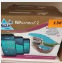
Lot n° 136 Coffret domotique IBACONNECT2 (PV 880 € TTC) Mise à prix : 200 €