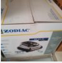
Lot n° 38 Robot ZODIAC 40XA IQ électrique Neuf (PV 1339,00 € TTC) Mise à prix : 300 €