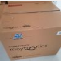
Lot n° 29 Robot IBAVAC PRO électrique Neuf (PV 1595,00 € TTC) Mise à prix : 350 €