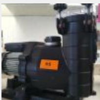
Lot n° 95 Pompe RENOVATION Renovo 1CV (PV 636 € TTC) Mise à prix : 150 €