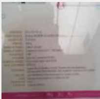
Lot n° 17 SPA IBIZA SUN 5 Places dont 1 allongée (210x210x92) modèle de démonstration mise en eau (à déconnecter électriquement, WAGO ou domino obligatoire) (PV 8990,00 € TTC) Mise à prix : 2000 € Attention : Il faut prévoir le démontage et remontage des portes du magasin pour sortir ce lot. L'étude prend la responsabilité de cette opération le jour de l'enlèvement le 11/04 à 9h30. Enlèvement impératif uniquement le 11/04 à 9h30.