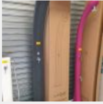
Lot n° 1 Douche Spring Solaire Standard Noir (PV 690,00 € TTC) Mise à prix : 150 €