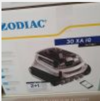
Lot n° 41 Robot ZODIAC 30XA IQ électrique Neuf (PV 1159,00 € TTC) Mise à prix : 250 €