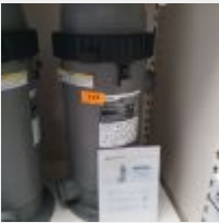
Lot n° 112 Filtre à cartouche ZODIAC CS150 (PV 786 € TTC) Mise à prix : 250 €