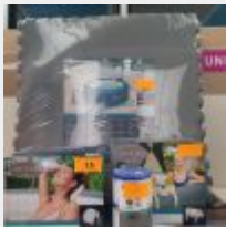
Lot n° 15 Ensemble de 2 Sets de tapis de sol pour SPA, 1 Appui-tête pour SPA gonflable, 1 Repose verre, 1 double filtre pour SPA gonflable. (PV total environ 120,00 € TTC) Mise à prix : 30 €