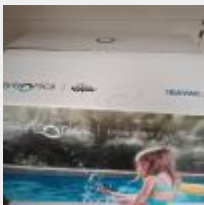
Lot n° 34 Robot IBAVAC ZEN électrique Neuf (PV 1150,00 € TTC) Mise à prix : 250 €