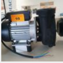
Lot n° 98 Pompe de circulation PHT 0,8 kW (PV 670 € TTC) Mise à prix : 150 €