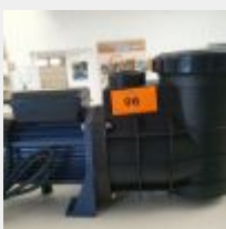
Lot n° 96 Pompe BERLING 1CV Mono (PV 233 € TTC) Mise à prix : 60 €