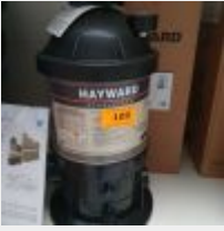
Lot n° 109 Filtre à cartouche STARCLEAR SC 5,7 m3/h (PV 508 € TTC) Mise à prix : 150 €