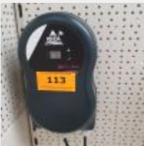
Lot n° 113 Electrolyseur IBASELMINI 15 m3 (PV 668 € TTC) Mise à prix : 200 €