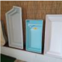
Lot n° 27 4 Mini piscines Mise à prix : 20 €