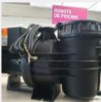
Lot n° 94 Pompe GEMFLOW à vitesse variable VS 1CV (PV 750 € TTC) Mise à prix : 200 €