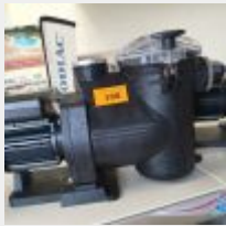
Lot n° 100 Pompe IBABUMP 0,50 CV (PV 388 € TTC) Mise à prix : 80 €