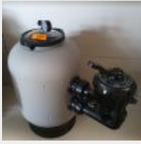
Lot n° 103 Filtre à sable SKYPOOL Side D400 (PV 225 € TTC) Mise à prix : 50 €