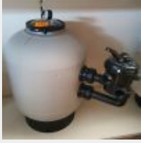
Lot n° 104 Filtre à sable SKYPOOL Side D500 (PV 250 € TTC) Mise à prix : 60 €