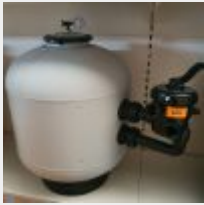
Lot n° 105 Filtre à sable SKYPOOL Side D600 (PV 301 € TTC) Mise à prix : 80 €