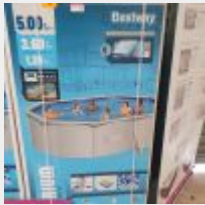
Lot n° 4 Piscine Hors Sol BESTWAY HYDRIUM Ovale (500 x 360 x 120 cm) neuve (PV 1193,00 € TTC) Mise à prix : 250 €