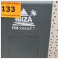
Lot n° 133 Coffret domotique IBACONNECT1 (PV 400 € TTC) Mise à prix : 100 €