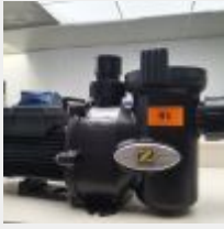
Lot n° 91 Pompe ZODIAC à vitesse simple 1CV (PV 729 € TTC) Mise à prix : 200 €