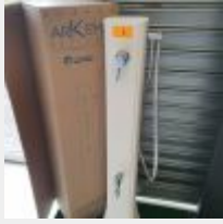
Lot n° 2 Douche Happy Go Solaire Standard Blanc (PV 340,00 € TTC) Mise à prix : 70 €