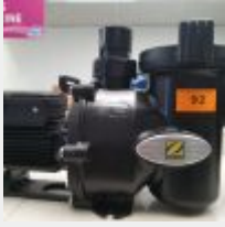
Lot n° 92 Pompe ZODIAC à vitesse simple 0,75CV (PV 681 € TTC) Mise à prix : 150 €