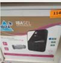
Lot n° 114 Electrolyseur IBASEL 45 m3 (PV 822 € TTC) Mise à prix : 200 €