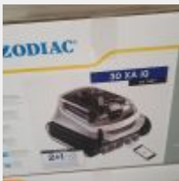
Lot n° 40 Robot ZODIAC 30XA IQ électrique Neuf (PV 1159,00 € TTC) Mise à prix : 250 €