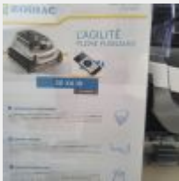
Lot n° 39 Robot ZODIAC 30XA IQ électrique Neuf (PV 1159,00 € TTC) Mise à prix : 250 €