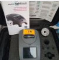
Lot n° 28 Analyseur d'eau SPIN TOVEM WATER LINK RMN 26 830 dans sa mallette (PA : environ 2500 euros) Mise à prix : 500 €