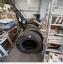
Lot n° 139 13 Pneus poids lourds d'occasion rechapé et occasion différentes tailles MICHELIN Mise à prix : 500€