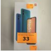
Lot n° 33 Téléphone portable REDMI 9A dans sa boîte, sans chargeur Mise à prix : 80€