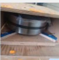
Lot n° 143 Roulement SKF-22330CC / W33 Mise à prix : 80€ Vendus par la SVV ADJUGE, Frais de vente 24% TTC