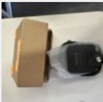
Lot n° 36 Trépied vidéo NEEWER03/23 Micro BOYA EY M1S Support adaptateur téléphone Lumière Mise à prix : 50€