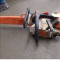
Lot n° 103 Elagueuse STIHL MS201TC, 2016 Mise à prix : 150€