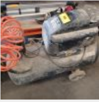
Lot n° 90 Petit Compresseur MERCURE sur roues (50 litres) Mise à prix : 40€