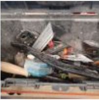
Lot n° 86 Lot de 8 barres de maintien "3ème main", 2 serre-joints, caisse à outils garnie Mise à prix : 40€