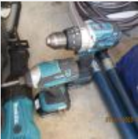
Lot n° 94 Caisse à outils STANLEY FATMAX sur roulettes garnie 1 Visseuse MAKITA sans batterie Multimètre FLUKE 7600 Petit outillage, marteau, niveau, pince-coupante, tournevis Mise à prix : 80€