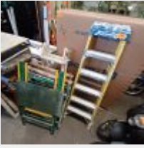
Lot n° 138 Escabeau jaune Echelle formant plateforme MACC 3 Etablis MACC Mise à prix : 200€