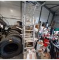
Lot n° 140 Sauterelle DUARIB TANDEM Environ 17 Tréteaux 2 Planches à roulettes 3 Escabeaux Mise à prix : 80€