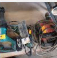
Lot n° 95 Scie sabre MAKITA avec 1 accu, sans chargeur Perceuse BOSCH PSB550R filaire Perforateur HILTI TE300 Boite de forêts Mise à prix : 150€