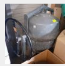
Lot n° 157 Bétonnière électrique ALTRAD 300 L Mise à prix : 150€