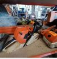
Lot n° 102 Tronçonneuse STIHL MS441C, 2013 Mise à prix : 150€