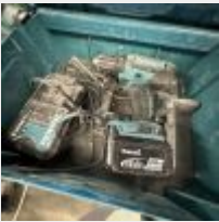
Lot n° 87 Visseuse MAKITA DDF482, accu, chargeur dans son coffret Mise à prix : 50€