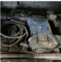
Lot n° 117 Marteau Piqueur GO ON (fonctionne) Marteau Piqueur HYUNDAI (fonctionne) Visseuse GO ON (fonctionne) Marteau piqueur TITAN (HS) Marteau piqueur ENERGER (HS) Mise à prix : 200€