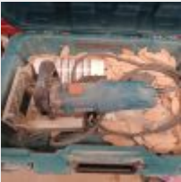
Lot n° 88 LAMELO VIRUTEX AB111N dans sa boite Mise à prix : 50€