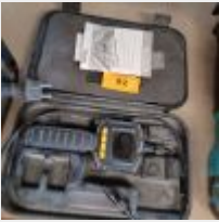
Lot n° 92 Caméra endoscopique POWERFIX PEK2.3 A1 dans sa valise Mise à prix : 80€