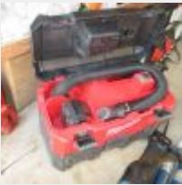
Lot n° 93 Aspirateur MILWAUKEE Enrouleur 25m BIZLINE Mise à prix : 120€