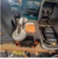
Lot n° 114 2 Ventouses à pompe TECHPRO en boîte Ventouse double Mise à prix : 40€