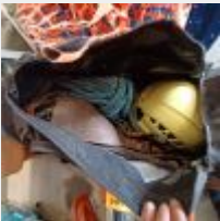
Lot n° 105 Kit grimpeur : baudrier, corde, 2 griffes, casque Mise : 30€