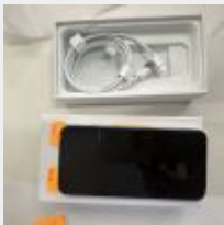
Lot n° 34 Iphone SE3 2022 64go Mise à prix : 80€