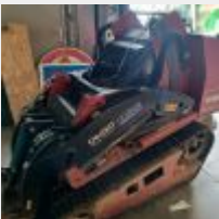
Lot n° 106 Porte-outils TORO DINGO TX1000W, n°405447650, 423H, acheté 37 951€TTC en 2019 avec : Broyeur CANGINI 095A143K101X1, n°0038202, 2018, 1m20, acheté 5 641€TTC en 2019 Rogneuse de souche TORO n°403400874, achetée 5 432€TTC en 2019 Pince à arbre CANGINI Ding n°086BAXXK101X1, achetée 4 440€TTC en 2019 Godet grapin TORO n°3190021062, 22577, acheté 3 553€TTC en 2019 Godet gros volume TORO 250L, 2018, 1 208€TTC en 2019 Outil multi-usages TORO n°403435186, acheté 852€TTC en 2019 Niveleuse 91 cm TORO n°403444792, achetée 800€40TTC en 2019 Jeu de chenilles caoutchouc déclaré changé récemment sur le porte-outils. Entretien régulier jusqu'à l'arrêt de l'entreprise Soit un total TTC de 59 877€40 Vendu par la SVV ADJUGE, frais de vente : 24%TTC Mise à prix : 8 000€