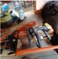
Lot n° 104 Elagueuse STIHL MS201TC, 2016 Mise à prix : 150€