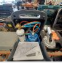
Lot n° 113 OXYPOWER chalumeau camping gaz Mise à prix : 40€