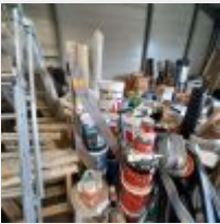
Lot n° 141 Stock et outillage comprenant : Revêtements de sol TARKET Lames de parquet souple TARKET Nez de marche Papier peint, isolant Pots de peinture entamés Desserte rouge 2 Diabes Meuble caissette à roulettes Aspirateur KARCHER 5 Tables à tapisser Corde Radiant ROMUS Mise à prix : 150€