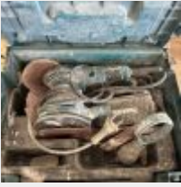
Lot n° 84 Scie sabre MAKITA dans son coffret Mise à prix : 40€