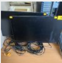
Lot n° 35 2 Ecrans ACER 23,8 pouces (achat 129,94 euros TTC pièce en 05/22) 6 Supports ordinateurs Mise à prix : 80€