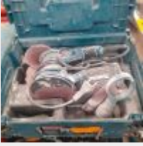
Lot n° 85 Ponceuse MAKITA orbitale B05041 Mise à prix : 40€