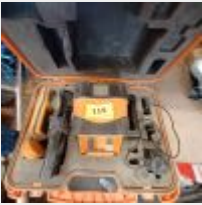
Lot n° 115 Laser FL100 HA Mise à prix : 100€