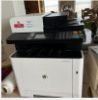
Lot n° 32.2 Multifonction OLIVETTI D-COLOR MF2624 (LAMY) Mise à prix : 100€