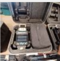
Lot n° 118 Visseuse TECCPO sans chargeur Soudeuse fibre VIEW ARC FUSION SPLICER (HS), s'allume + Soudeuse fibre FUJI CURA 70S (HS) Une alimentation pour les 2 soudeuses Harnais 6 Panneaux de signalisation tordus Perforateur BOSCH GBH 36V LI (HS) Mise à prix : 10€