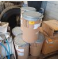
Lot n° 142 6 Bidons de Sodium Formate SAFC Sigma Aldrich 71540 Mise à prix : 50€ Vendus par la SVV ADJUGE, Frais de vente 24% TTC