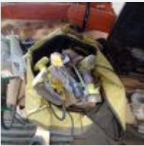
Lot n° 116 Visseuse, meuleuse (2 accu, 1 chargeur) dans une sacoche Scie circulaire RYOBI filaire (fonctionne le 05/07) Scie égoïne Reste de chantier Disqueuse MAKITA (HS) Mise à prix : 80€