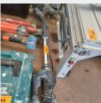
Lot n° 89 Girafe SCHEPPACH Mise à prix : 50€