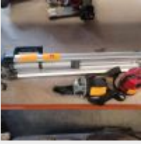
Lot n° 91 2 Lasers TITAN et sans marque avec un trépied métal Mise à prix : 50€