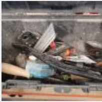
Lot n° 86 Lot de 8 barres de maintien "3ème main", 2 serre-joints, caisse à outils garnie Mise à prix : 40€