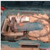
Lot n° 88 LAMELO VIRUTEX AB111N dans sa boite Mise à prix : 50€