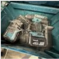
Lot n° 87 Visseuse MAKITA DDF482, accu, chargeur dans son coffret Mise à prix : 50€