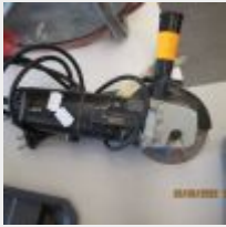
Lot n° 21 Meuleuse ASK Mise à prix : 10 €