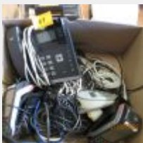
Lot n° 67 Deux TPE - Un téléphone fixe Yaeh Link, une scannette Symbol et divers câblages Mise à prix : 20€