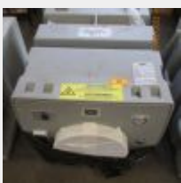
Lot n° 30 1 Extracteur SMH modèle NPU 2500 Obligation d'être certifié pour le traitement de l'amiante Mise à prix : 400 €