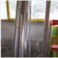
Lot n° 27 Lot de stock : laine de verre ISOVER, carton de silicone SODAL SILIRUB NEO5T, visserie HILTI SDS01B, quincaillerie, rails à placo + 2 Règles alu + 2 Equerres alu + Niveau Mise à prix : 50€