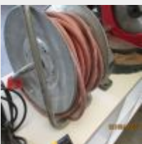
Lot n° 18 Enrouleur Mise à prix : 10€