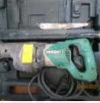
Lot n° 7 Scie sabre HIKOKI CR13V2 Mise à prix : 40 €