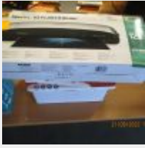
Lot n° 69 Plastifieuse FELLOWES SPECTRA A3 1 carton Feuille A4 Mise à prix : 10 €