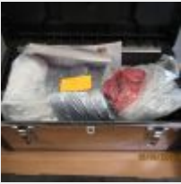
Lot n° 9 Meuleuse BOSCH Professionnel GWS125 avec fraiseuse A80 Obligation d'être certifié pour le traitement de l'amiante Mise à prix : 80 €