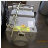
Lot n° 29 1 Extracteur SMH modèle NPU 2500 Obligation d'être certifié pour le traitement de l'amiante Mise à prix : 300 €