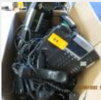
Lot n° 71 6 Téléphones sur base POLYCOM 1 PANASONIC 1 Gigaset 1 huawei Mise à prix : 20 €