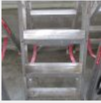
Lot n° 25 3 Marches EQUIP WURTH Mise à prix : 20€