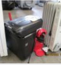
Lot n° 13 Destructeur de document Fellowes 60 CS, cafetière Bosch, radiateur Listo Mise à prix : 10 €