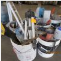
Lot n° 23 Lot de 3 pistolets à silicone, paire de tréteaux, scie égoïne, 2 couteaux à laine de verre, coffret de visserie MACC, pinces, spatules, ... Mise à prix : 20€