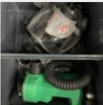
Lot n° 11 6 masques et batteries dont un neuf et un HS (450/600€ neuf) Obligation d'être certifié pour le traitement de l'amiante Mise à prix : 80 €