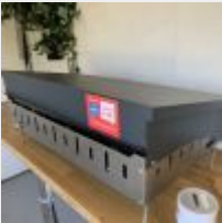
Lot n° 15 Plancha LE MARQUIER gaz 3 brûleurs avec couvercle, Année 2021 + Bouteille de gaz Mise à prix : 200 €