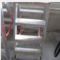
Lot n° 24 3 Marches EQUIP WURTH Mise à prix : 20€