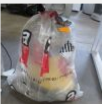
Lot n° 12 1 Aspirateur ATTIX amianté Obligation d'être certifié pour le traitement de l'amiante Mise à prix : 50 €