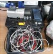
Lot n° 10 Appareil de contrôle alarmiante V1 N°de série 5F180909646 Prochain contrôle 18/10/2022 pouvant s'adapter au dépressiomètre SMH Obligation d'être certifié pour le traitement de l'amiante Mise à prix : 200 €