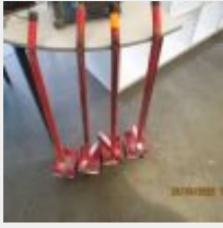
Lot n° 19 4 Cales plaques rouges Mise à prix : 10 €