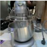
Lot n° 16 Robot pâtissier KITCHEN AID 6,9 litres + accessoires (trancheur, râpes) Mise à prix : 100 €