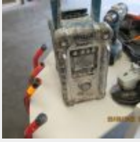
Lot n° 20 Visseuse MAKITA DDF484 + Radio de chantier MAKITA avec 2 accu (1 MAKITA, 1 adaptable) et 1 chargeur Fonctionnent le 19 09 Mise à prix : 50€