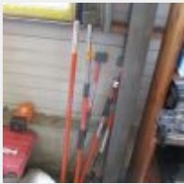
Lot n° 28 5 Tirants poussants Mise à prix : 40 €