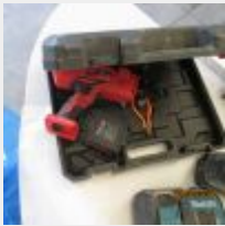
Lot n° 22 Ligatureuse (fonctionne) Mise à prix : 150€ Vendue par la SVV ADJUGE, frais : 20%HT