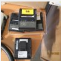
Lot n° 66 4 imprimantes portatives EPSON TM P80/Model M316 Bluetooth Vendu sans chargeur Mise à prix : 20€