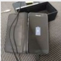
Lot n° 70 Téléphone portable SAMSUNG Galaxy S7 Fonctionne, mot de passe dans la boîte, pas de chargeur Mise à prix : 50€