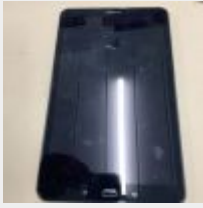
Lot n° 64 Tablette SAMSUNG SM-T 580 avec chargeur Mise à prix : 30 €