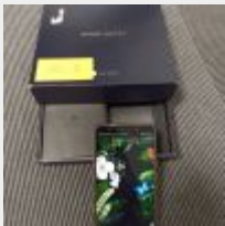
Lot n° 70 Téléphone portable HUAWEI Mate 10 Pro avec chargeur Fonctionne, mot de passe dans la boîte. Mise à prix : 50€