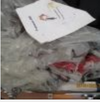
Lot n° 8 Meuleuse BOSCH Professionnel GWS125 avec fraiseuse A80 Obligation d'être certifié pour le traitement de l'amiante Mise à prix : 80 €