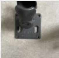
Lot n° 65 Un lot comprenant : Appareil métallique circulaire de marque Trimble série 70102-03 Volant noir fourni avec un écran de manoeuvre 2 Supports métallique inscrit RAM série RMR-176-1 2 Câbles électriques faisant partie du système de navigation Trimble Appareil rectangulaire de marque Trimble, muni de douilles standards de différentes tailles, inscrit TM-200 AG-815 2 Appareils blancs et gris forme circulaire de marque Trimble AG-25 GNQQ série MAP59232039 & MAP60061220 Appareil de forme carrée de marque Trimble NAV900 VABTAGE SPEKTRA AGRICULTURE PRECISION FERMING Série partielle 8400232 2 Moniteurs de forme rectangulaire, couleur noire de marque Trimble, série TMX-2050 - 96700-00 et 5415550369 & série XCN - 2050 9670080 6004550513 Pas de TVA récupérable Mise à prix : 100 €