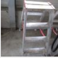
Lot n° 26 3 Marches EQUIP WURTH Mise à prix : 20€