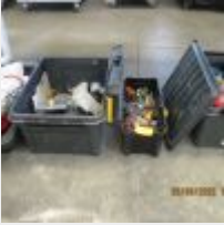
Lot n° 14 5 Caisses plastique garnie de matériel à main, agrafeuses, raccords, robinets, forêts, embout de vissage. Mise à prix : 20 €