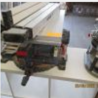
Lot n° 17 Scie sur table BOSCH GTM12JL, 02/18, n°802000120 Mise à prix : 100 €