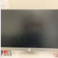
Lot n° 64 Ordinateur ASUS HDMI PENTIUM avec unité centrale intégrée Clavier souris et alimentation Mise à prix : 30 €