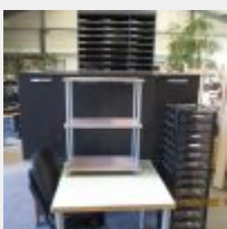
Lot n° 72 Un lot comprenant : Un bureau démonté + une table pliante + 2 meubles à hauteur d'appui à quatre portes + 2 trieurs + 2 chaises visiteurs + 1 fauteuil de direction + 1 sellette à trois niveaux + 1 table carrée Mise à prix : 20 €