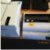
Lot n° 70 Relieuse FELLOWES PULSAR 300 Mise à prix : 10 €