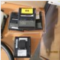
Lot n° 66 4 imprimantes portatives EPSON TM P80/Model M316 Bluetooth Vendu sans chargeur Mise à prix : 20€