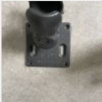
Lot n° 65 Un lot comprenant : Appareil métallique circulaire de marque Trimble série 70102-03 Volant noir fourni avec un écran de manoeuvre 2 Supports métallique inscrit RAM série RMR-176-1 2 Câbles électriques faisant partie du système de navigation Trimble Appareil rectangulaire de marque Trimble, muni de douilles standards de différentes tailles, inscrit TM-200 AG-815 2 Appareils blancs et gris forme circulaire de marque Trimble AG-25 GNQQ série MAP59232039 & MAP60061220 Appareil de forme carrée de marque Trimble NAV900 VABTAGE SPEKTRA AGRICULTURE PRECISION FERMING Série partielle 8400232 2 Moniteurs de forme rectangulaire, couleur noire de marque Trimble, série TMX-2050 - 96700-00 et 5415550369 & série XCN - 2050 9670080 6004550513 Pas de TVA récupérable Mise à prix : 100 €