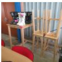
Table de réunion ovale + 4 sièges rouges