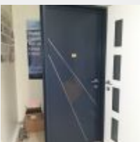
Lot n° 209.2 Porte d'entrée Mise à prix : 300€