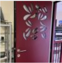
Lot n° 209 Porte d'entrée Mise à prix : 3000€