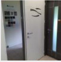
Lot n° 209.3 Porte d'entrée Mise à prix : 300€