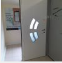
Lot n° 209.4 Porte d'entrée Mise à prix : 300€