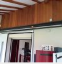
Lot n° 206 Store banne FRANCIAFLEX, télécommande Mise à prix : 300€