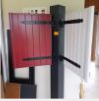
Lot n° 207 4 Petits volets PVC sur présentoir Mise à prix : 150€