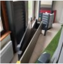
Lot n° 208 Lot de 3 garde-corps CADIOU (7 éléments) Mise à prix : 250€