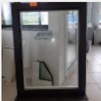
Lot n° 210 Fenêtre FENETRA alu blanc et gris Mise à prix : 50€