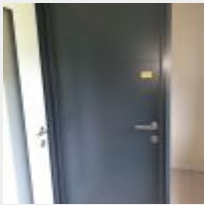
Lot n° 209.6 Porte d'entrée Mise à prix : 300€