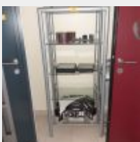
Lot n° 211 Étagère, 3 Chaises pliantes, Garde-corps rouge alu CADIOU, Réfrigérateur CANDY, Micro-ondes FAGOR, Machine à café, Bouilloire, Vaisselle, Extincteur, Porte-revues métal, Produits de nettoyage. Mise à prix : 200€