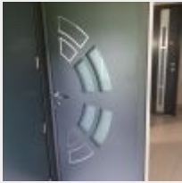
Lot n° 209.5 Porte d'entrée Mise à prix : 300€