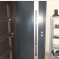
Lot n° 209.1 Porte d'entrée Mise à prix : 300€