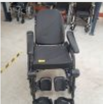
Lot n° 50 Fauteuil roulant manuel ACTION 3 NG confort rockingchair taille 45,5 Mise à prix : 250€