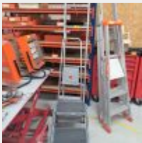
Lot n° 22 Brin d'échelle TUBESCA, Escabeau alu ARTUB 2 marches, Escabeau Marche-pieds WILTEC Mise à prix : 60€