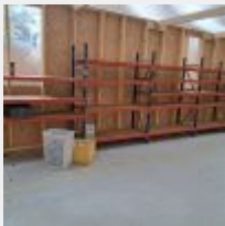
Lot n° 44.6 3 Racks 1 travée orange et bleu charges légères + 2 Racks 5 travées orange et bleu charges légères + 1 Rack 2 travées orange et bleu charges légères + 4 Racks 3 travées orange et bleu charges légères + 2 Rack 4 travées orange et bleu charges légères + Rack formant établi Mise à prix : 800€