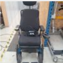
Lot n° 85 Fauteuil électrique B400 AA2 Taille 43 P45 ID avec chargeur (Prix de vente : 1990€ TTC) Mise à prix : 600€