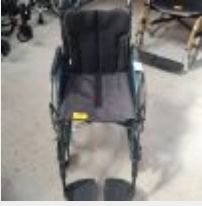
Lot n° 47 Fauteuil roulant manuel OTTOBOCK Avant garde DFT42 Mise à prix : 400€