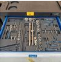
Lot n° 27 Servante SCHEPPACH garnie d'outillage à main Mise à prix : 300€