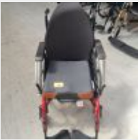
Lot n° 49 Fauteuil roulant manuel ACTION 4NG-DFT-43 Siège modulaire évolutif INVACARE (Prix de vente 700€ TTC) Mise à prix : 250€