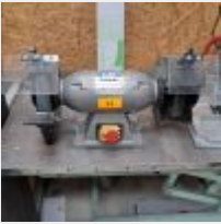
Lot n° 32 Touret PROMAC 324F Wire Wheel Grinder Mise à prix : 30€