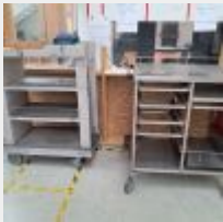
Lot n° 44.1 Desserte inox 16 niveaux, Etagère PVC sur roulettes 3 niveaux, Desserte inox 6 niveaux, Table de préparation rectangulaire montée avec éléments de rack, Table élévatrice électrique montée avec 1 lit médicalisé, Petite table élévatrice montée avec 1 lit médicalisé Mise à prix : 100€