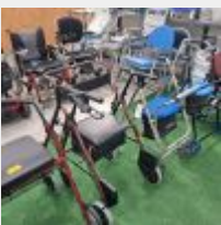
Lot n° 74 Lot de 6 déambulateurs dont marque FORTA, IDENTITES Mise à prix : 60€