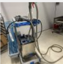
Lot n° 110 Matériel de désinfection SANIVAP SP600 avec lance, Brumisateur "7 d'Armor" électrique, Mise à prix : 800€