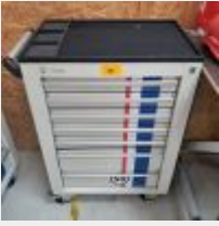
Lot n° 30 Servante WURTH garnie d'outillage à main Mise à prix : 350€