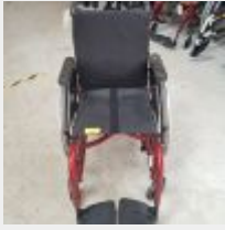
Lot n° 52 Fauteuil roulant manuel COMPACT (Prix de vente 1190€ TTC) Mise à prix : 400€