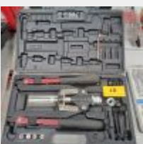
Lot n° 18 Pince pose-insert MULTI5, Coffret de filières et tarauds TIVOLY, Pince à rivets rapides et fournitures, Pompe à graisse Mise à prix : 40€