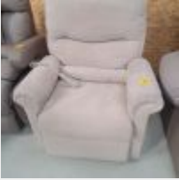
Lot n° 82 Lot de 4 fauteuils de salon électriques dont 1 sur roulettes (1 crème, 1 taupe, 2 marrons) Mise à prix : 1000€