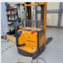
Lot n° 44.8 Élévateur électrique JUNGHEINRICH (fonctionne) Chargeur électrique EUROTRON (1 400 kg) 2003 Mise à prix : 1600€