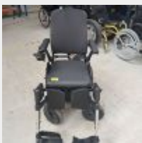
Lot n° 63 Fauteuil roulant électrique SEDEO Lite Quickie AAZ Q400R taille 43 avec chargeur (fonctionne) (Prix de vente : 2460€ TTC) Mise à prix : 820€