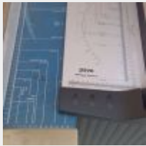
Lot n° 143 3 Bureaux, 6 Tables et 1 Petite table, Petite table en bois et métal sur roulettes, Armoire métal, 2 Armoires à hauteur d'appui, 6 Caissons à roulettes, Etagères, 3 Sièges de bureau, Chariot métallique, Coffre-fort BRICARD avec clé, Ecran ordinateur, TV PROLINE L3935HD LED, Climatiseur BESTRON, Massicot PAVOT, Destructeur de papier FELLOWES, Caisses PVC grises, Téléphone sur base YEALINK Mise à prix : 250€