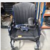
Lot n° 45 Fauteuil roulant manuel ECLIPS XXL60 (prix de vente 1371€ TTC) Mise à prix : 400€