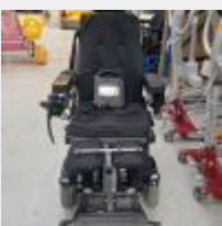
Lot n° 86 Fauteuil roulant électrique VICAIR C400 Permobil avec chargeur Mise à prix : 1000€