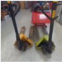
Lot n° 21.1 Transpalette 2,2T LIFTER Transpalette 2T Manulevage Mise à prix : 200€