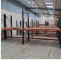
Lot n° 44.5 18 Travées de racks oranges et bleus 55 échelles et 117 lisses Mise à prix : 900€