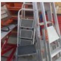
Lot n° 23 2 Escabeaux alu : TUBESCA 2 marches et CENTAURE 4 marches Mise à prix : 40€