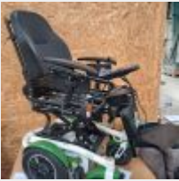
Lot n° 71 Fauteuil roulant électrique YOU-Q avec chargeur manque 1 coussin (Prix de vente : 2940€ TTC / prix neuf : 5900€ TTC) Mise à prix : 1000€