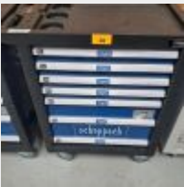
Lot n° 28 Servante SCHEPPACH garnie d'outillage à main Mise à prix : 300€