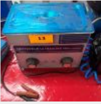
Lot n° 13 Nettoyeur ultrasons PRO+ Analog Mise à prix : 30€