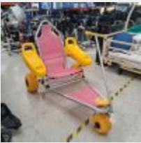
Lot n° 108 Ensoleillade fauteuil flotteur (Prix de vente : 1250€ TTC) Mise à prix : 400€