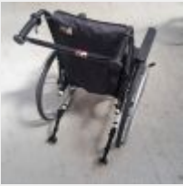
Lot n° 48 Fauteuil roulant manuel STYLE X Ultra T43 Mise à prix : 300€