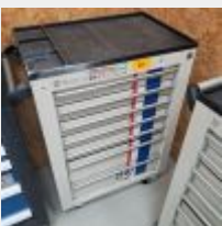
Lot n° 29 Servante WURTH garnie d'outillage à main Mise à prix : 350€