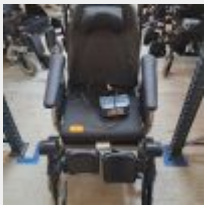
Lot n° 56 Fauteuil roulant avec assistance INVACARE taille 55 avec chargeur (fonctionne) Mise à prix : 300€