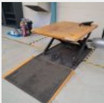
Lot n° 44.2 Table élévatrice électrique jaune 1000kg L: 145 x l:114, 220V avec pupitre de commande et rampe d'accès Mise à prix : 450€