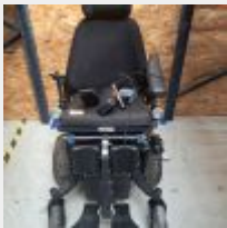
Lot n° 62 Fauteuil roulant électrique FRONTIER M avec chargeur (accoudoirs à revoir) (fonctionne) Mise à prix : 300€