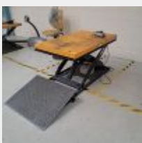
Lot n° 44.3 Table élévatrice électrique jaune 1000kg avec télécommande, 220V, L: 130 x l 80cm avec boîtier de commande et rampe d'accès Mise à prix : 450€