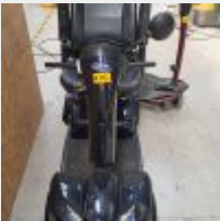
Lot n° 84 Lot de 2 scooters : - ELECTRIC MOBILITY 3 roues, - INVACARE Leo 4 roues avec 1 chargeur Mise à prix : 400€