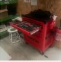
Lot n° 25 Servante KSTOOLS Racing garnie d'outillage à main Mise à prix : 300€