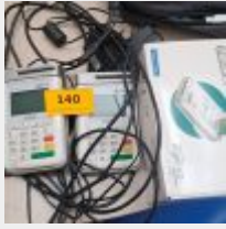
Lot n° 140 2 Lecteurs de carte vitale Mise à prix : 30€