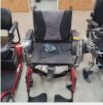
Lot n° 70 Fauteuil roulant électrique ERGO CONCEPT Icon avec chargeur (Prix de vente : 1745€ TTC) Fauteuil roulant électrique ACTION 3NG taille 50,5 avec chargeur (Prix de vente 279€ TTC) Mise à prix : 600€