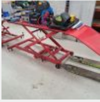
Lot n° 42 Table élévatrice rouge mécanique 450 kg avec rampe d'accès Mise à prix : 80€