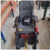
Lot n° 60 Fauteuil roulant électrique INVACARE TDXSP2 avec chargeur (fonctionne) (Prix de vente : 2590€ TTC) Mise à prix : 800€