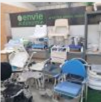
Lot n° 83 6 Etagères garnies de pots de chambre, sièges de bain, chaises percées, tabourets, béquilles, cannes, cannes tripodes, bacs à shampoing gonflable, barres d'appui à ventouses, planches de bain, enfile-bas, réhausseurs... 3 Tables à roulettes Mise à prix : 600€