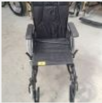
Lot n° 55 Fauteuil roulant manuel ACTION3 taille 40,5 (Prix de vente 430€ TTC) Mise à prix : 100€