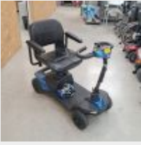
Lot n° 69 Scooter 4 roues INVACARE Colibri avec chargeur Mise à prix : 300€