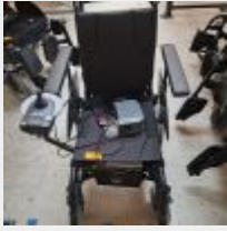
Lot n° 58 Fauteuil roulant électrique ESPRIT ACTION 4NG avec chargeur (fonctionne) Mise à prix : 300€