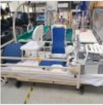
Lot n° 107 Châssis de lit médicalisé avec bas de lit et gardes corps, 2 Chariots de bain MEDIA ATLANTIC (2320€), Chariot de bain sans coussin, Lève-personne électrique MAXIMOV, (prix de vente 3500€ TTC) Lit médicalisé pour enfant électrique, Siège de bain ERGOBAIN, Chaise à pome CALYPSO, Lit baignoire modulable, Elévateur de siège de baignoire, Siège de bain, béquille de soutien, bassins, réhausseur, fauteuil de douche bébé Mise à prix : 2000€