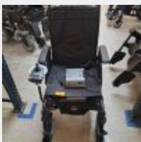
Lot n° 57 Fauteuil roulant électrique ESPRIT ACTION 3/4 taille 45,5 avec chargeur (fonctionne, batterie?) Mise à prix : 300€