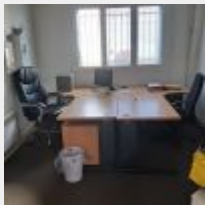
Lot n° 142 Mobilier réparti dans 2 bureaux comprenant : 3 Bureaux dont 1 bureau d'angle, 3 Caissons dont 2 sur roulettes, 2 Tables, Armoire métallique à rideaux, Colonne métal 4 tiroirs de dossiers suspendus, Etagère métal grise 4 niveaux (très bel état), Meuble métal à hauteur d'appui type classeur, Desserte à roulettes 2 niveaux, Ecran HP L1945WV, 2 Téléphones fixes YEALINK, Coffre-fort PHOENIX, 3 Sièges sur roulettes, 2 Chaises visiteur, 2 Sièges, Radiateur électrique, Ventilateur, Armoire à pharmacie avec clé et fournitures, Lampe, 2 Extincteurs dont 1 petit, Etagère murale blanche, 2 Tableaux blancs WELEDA, Tableau mural liège, 5 Poubelles, Marche-pieds, Horloge murale plastique Mise à prix : 250€