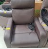
Lot n° 81 Lot de 4 fauteuils de salon électriques dont 2 sur roulettes Mise à prix : 1000€