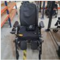
Lot n° 61 Fauteuil roulant électrique INVACARE BL141MA11248C avec chargeur (fonctionne) (Prix de vente : 5362€ TTC) Mise à prix : 1700€