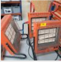
Lot n° 19 3 Chauffages ventilation rafraichissement 220V Mise à prix : 60€