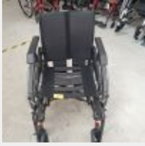
Lot n° 53 Fauteuil roulant manuel SIXI RUPIANI (Prix de vente 518€ TTC) Mise à prix : 150€