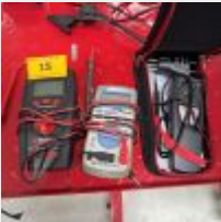
Lot n° 15 Lot de 3 multimètres (2 WURTH, 1 AUTO RANGING) Mise à prix : 30€