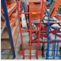
Lot n° 20 Diable rouge HABRIAL Mise à prix : 40€