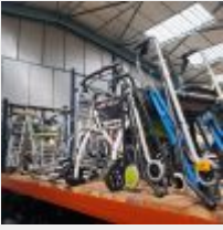
Lot n° 105 Lot d'environ 44 déambulateurs Mise à prix : 440€