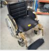
Lot n° 46 Fauteuil roulant manuel ECLIPS ECL55 (prix de vente 1370€ TTC) Mise à prix : 400€