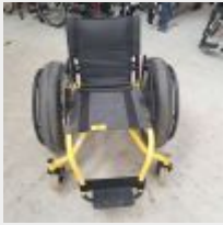
Lot n° 54 Fauteuil roulant manuel COLOURS-DF (Prix de vente : 1050€ TTC) Mise à prix : 300€