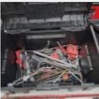
Lot n° 17 2 Caisse à outils OPSIAL dont 1 garnie de clés allen, arrache-roulement, Caisse WURTH garnie d'outils à main (pinces mutiprise, marteaux, fôrets) Caisse à outils FACOM Caisse tissu FACOM avec film étirable, massette, maillet Mise à prix : 50€