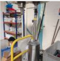
Lot n° 109 2 Appareils de chauffage gaz Mise à prix : 100€