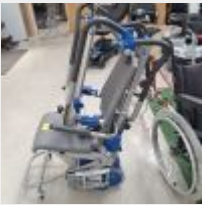
Lot n° 72 Monte-escalier universel SANO LIFTKAR 2 en 1 avec chargeur (Prix de vente : 2500€ TTC) Mise à prix : 800€