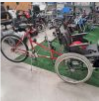
Lot n° 73 Vélo pousseur pour fauteuil roulant Action 4 avec un casque (Prix de vente : 600€ TTC) Mise à prix : 200€