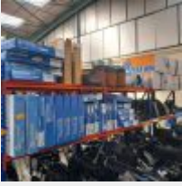
Lot n° 106 Lot de 27 coussins anti-escarres SYST'AM, 7 repose-pieds anti-escarres, 9 matelas SYST'AM, 3 Assises, 15 dossiers, caillebotis sortie de douche, rampes de seuil de douche, 2 rampes de seuil caoutchouc, 2 rampes de seuil alu, 1 lit médicalisé électrique, 17 coussins de positionnement SYST'AM et ROZ IN FORM, planches de transfert BANANA, barres d'appui baignoire, 5 coussins, jeu de rampe (283€), fixations pour fauteuils, 4 planches de bain, bassins, 4 caisses plastique de sangles MOLIFT, 3 Etagères métal Mise à prix : 300€