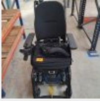
Lot n° 59 Fauteuil roulant électrique QUANTUM Stretto AA2 avec chargeur (fonctionne) (Prix de vente 1860€ TTC) Mise à prix : 600€