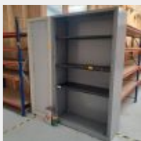
Lot n° 143.1 4 Armoires hautes à portes coulissantes, 1 Armoire basse, 1 Trieur Mise à prix : 60€