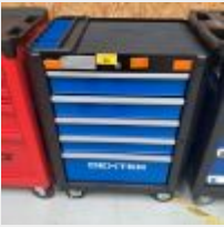
Lot n° 26 Servante DEXTER garnie d'outillage à main Mise à prix : 300€