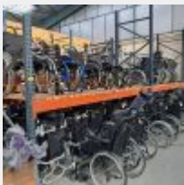
Lot n° 44.7 7 Travées de racks jaunes et bleus 9 échelles et 42 lisses charges semi-lourdes 4 Travées de racks charges lourdes 6 échelles 12 lisses Mise à prix : 500€