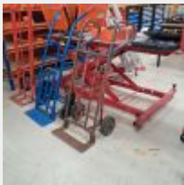
Lot n° 44 Table élévatrice mécanique 450kg Mise à prix : 80€