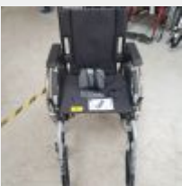
Lot n° 51 Fauteuil roulant semi-assisté électrique INVACARE FOREST3-AA1-T44P45-DI-AI avec chargeur et télécommande (batterie à revoir) Mise à prix : 300€