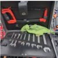
Lot n° 16 Caisse à outils TALABOT comprenant scie à métaux, clés plates, tournevis, multimètre, douilles, cliquets, embouts, marteaux. Caisse à outils DEXTER garnie d'outils à main Mise à prix : 50€