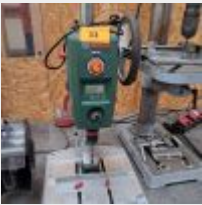
Lot n° 33 Perceuse sur colonne BOSCH PBD40 Mise à prix : 60€