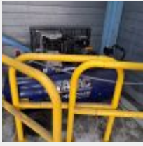
Lot n° 44.4 Compresseur sur roues ABAC CHROME 270L avec soufflette Mise à prix : 350€