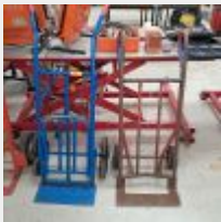
Lot n° 21 Diable bleu 3 roues HAILO 250kg Diable avec roues simples Mise à prix : 60€