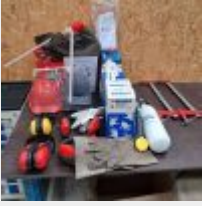
Lot n° 31 Table plateau bois piètement métal garnie d'EPI, 2 serre-joints, 3 étaux, Petite table à roulettes Mise à prix : 20€