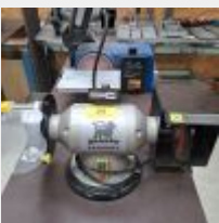
Lot n° 35 Touret PEUGEOT Energy Grind-150BP sur table à roulettes, Petit tank à poncer SHEPPACH, Caisse garnie de câbles et prises Mise à prix : 60€