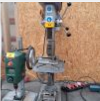
Lot n° 34 Perceuse sur colonne SIDAMO avec table élévatrice manuelle Mise à prix : 280€