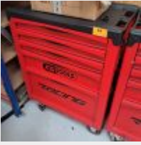
Lot n° 24 Servante KSTOOLS Racing garnie d'outillage à main Mise à prix : 300€