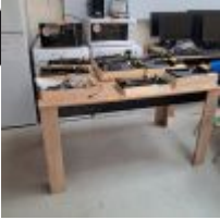
Table ovale de réunion, 2 Tables rectangulaires en mélaminé couloir bois et noir (1 pied abimé), 11 Chaises coque bleues, 8 Chaises visiteur, 8 Chaises pliables, Meuble bas, Climatiseur TAURUS Alpatoc, 2 Réfrigérateurs WHIRLPOOL dont 1 HS, Cafetière DELONGHI Magnificas, 2 Cafetières SENSEO, 3 Bouilloires dont 1 RUSSELL HOBBS, Ventilateur sur pied, Four SEB, 2 Micro-ondes, Tableau liège, Armoire métallique avec cadenas fermé sans clé, Porte-parapluie métallique, Poubelles de tri Mise à prix : 400€