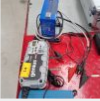
Lot n° 14 Chargeur INVICARE 24V, Chargeur BLUEPOWER 24V, Chargeur NOCO Genius 1224 (manque prise), Testeur de batterie LECLANCHE avec possibilité d'imprimer (branchement USB) Mise à prix : 100€