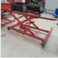
Lot n° 43 Table élévatrice mécanique 450kg Mise à prix : 80€