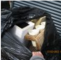
Lot n° 85 15 Pots métal rouge, or, osier Mise à prix : 150€ Vendus par la SVV ADJUGE, frais : 24%TTC