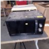
Lot n° 49 2 Micro-ondes SAMSUNG et KINGDHOME