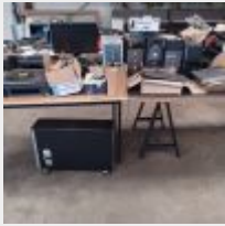
Lot n° 47 3 Imprimantes multifonctions 1 BROTHER et 2 SAMSUNG 7 UC DELL et PACKARD BELL (anciennes, mauvais état) Onduleur EATON Evolution 850 1 PACKARD BELL Téléphone 2 Claviers Le tout ancien, présenté démonté dans le box