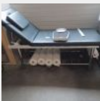
Lot n° 50 Table de soin 4 Rouleaux de papier Pèse personne ROBE