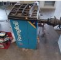
Lot n° 37 Équilibreuse RAVAGLIOLO Série H