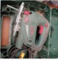
Lot n° 4 Scie sauteuse BOSCH PST 7200 E filaire