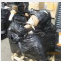
Lot n° 86 24 Jarres en osier Mise à prix : 150€ Vendus par la SVV ADJUGE, frais : 24%TTC