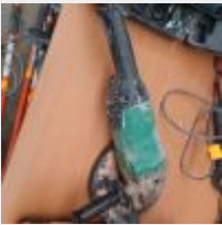
Lot n° 7 Meuleuse HITACHI G23ST filaire