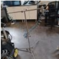
Lot n° 41 Sécheur VENTURE CLAS, 2017