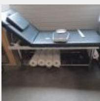
Lot n° 50 Table de soin 4 Rouleaux de papier Pèse personne ROBE