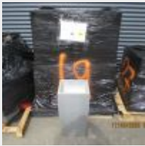
Lot n° 84 12 Pots carrés gris et blanc Mise à prix : 120€ Vendus par la SVV ADJUGE, frais : 24%TTC