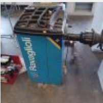
Lot n° 37 Équilibruse RAVAGLIOLO Série H