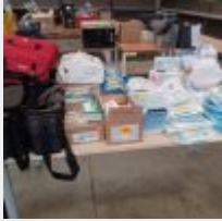
Lot n° 46 Liste du stock Matériel de soin : bandes, poches, protections, sets de pansement, adhésifs, masques, diffuseurs portables, gels hydroalcooliques, trocarts, seringues.... 5 Mallettes (4 noires MEDIBAG+ et 1 rouges URGO)