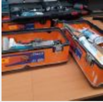
Lot n° 10 4 Caisses à outils THEARD avec fournitures de plaquiste (1), petit outillage (2) et mastique (1) + Valise noire