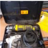
Lot n° 8 Multifonction STANLEY FASTMAX type 1 Mise à prix : 40€