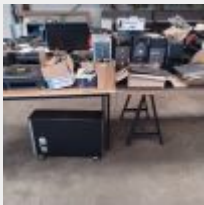
Lot n° 47 3 Imprimantes multifonctions 1 BROTHER et 2 SAMSUNG 7 UC DELL et PACKARD BELL (anciennes, mauvais état) Onduleur EATON Evolution 850 1 PACKARD BELL Téléphone 2 Claviers Le tout ancien, présenté démonté dans le box