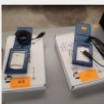
Lot n° 44 2 Boitiers lecteurs carte vitale ES KAP AD (pour utilisation à domicile, autonomes) 2 Boitiers lecteurs carte vitale OLAIN (à connecter à un PC portable)