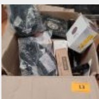
Lot n° 13 Phare SCANGRIP sans fil avec chargeur Cartons d'abrasifs MIRKA, trousse plaquiste L OUTIL PARFAIT (neuf), scrappers ROMUS neufs, 2 Casquettes neuves, marteau, Truelles ... Mise à prix : 60€