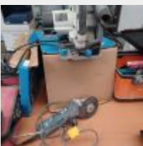
Lot n° 8 Meuleuse BOSCH GWS750 Scie circulaire MAC ALLISTER MSPS1200