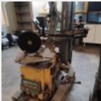
Lot n° 42 Démonte pneu TECHROLLER, 2017