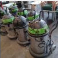
Lot n° 35 8 Aspirateurs ICA panda 640 (1 pour pièces, 4 sans flexible) Mise à prix : 200€