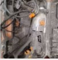
Lot n° 5 Perforateur TITAN MAGNESIUM TTB277SDS filaire