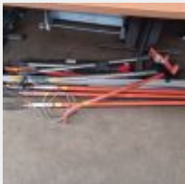
Lot n° 11 5 Étais troisième main THEARD 2 Niveaux 1 Cale porte 4 Perches 1 Trépied Mise à prix : 50€