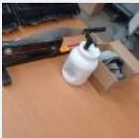
Lot n° 12 Massicot ROMUS LP 650 (65 cm) (très bon état) Paire de genouillères MONDELIN Pot de savon Mise à prix : 60€