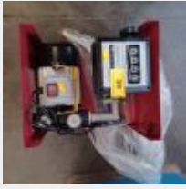
Lot n° 39 Pompe à carburant GO (état neuf)