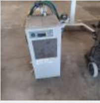
Lot n° 33 Compresseur 10 bars insonorisé MAUGIERE MAV 201, ES 3000 Déshumidificateur PARTENAIR ACT 23