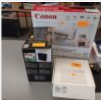
Lot n° 43 Multifonction CANON TS3151 (HS) Broyeur de documents FELLOWES P25S (HS) Routeur 4G HUAWEI Souris sans fil BLUESTORK