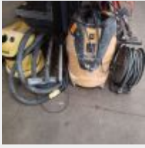
Lot n° 9 Aspirateur MIRKA (centrale d'aspiration girafe) Aspirateur KARCHER WD2 (servi 2 fois) Allonge