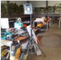
Lot n° 11 Projecteur sur pied SCANGRIP DUAL 2 en 1 système avec alimentation et accu Mise à prix : 40€