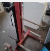
Lot n° 38 Lève roue rouge, 2017