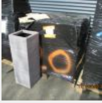
Lot n° 82 9 Grandes jarres carré marron Mise à prix : 100€ Vendus par la SVV ADJUGE, frais : 24%TTC