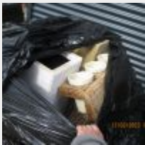
Lot n° 85 15 Pots métal rouge, or, osier Mise à prix : 150€ Vendus par la SVV ADJUGE, frais : 24%TTC