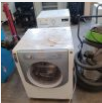
Lot n° 36 Machine à laver AQUALTIS HOTPOINT Sèche-linge ELECTROLUX Mise à prix : 100€