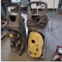
Lot n° 40 3 KARSCHER triphasés HD9-20-4M (manque prise) Non testés