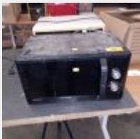
Lot n° 49 2 Micro-ondes SAMSUNG et KINGDHOME