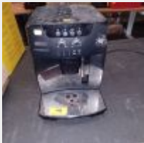
Lot n° 48 Machine à café DELONGHI MAGNIFICA