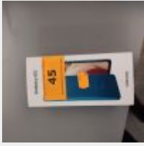
Lot n° 45 Téléphone portable SAMSUNG GALAXY A12 avec boitage