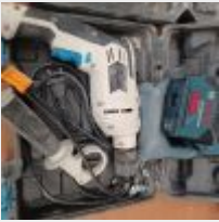
Lot n° 6 Laser BOSCH GCL 2 15 Perceuse MAC ALLISTER filaire