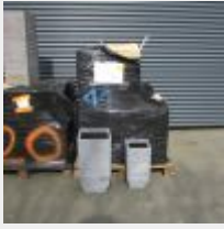
Lot n° 81 30 Pots en bois strié carré Mise à prix : 100€ Vendus par la SVV ADJUGE, frais : 24%TTC