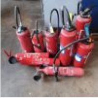
Lot n° 34 10 Extincteurs Mise à prix : 100€