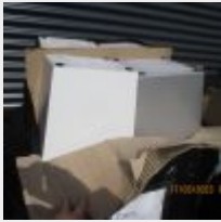
Lot n° 83 8 Grands cache pots gris et blanc Mise à prix : 100€ Vendus par la SVV ADJUGE, frais : 24%TTC