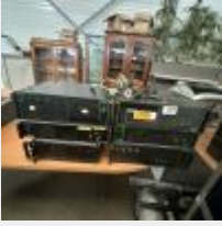
Lot n° 220.2 6 Amplificateurs BOUYER sans alim Mise à prix : 120€ TVA non récupérable Vendus par la SVV ADJUGE, frais de vente 24%TTC