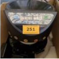
Lot n° 251 Trieur de pièces SR 1200 Mise à prix : 50€ TVA non récupérable