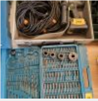
Lot n° 244 Visseuse FESTOOD DRC 18/4 avec accu Valise d'embouts MAKITA Mise à prix : 80€ TVA non récupérable