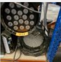
Lot n° 224 6 Spots led noir 64B Spot champignon Mise à prix : 60€ TVA non récupérable