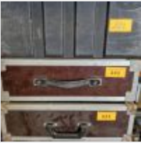
Lot n° 221 2 Flightcases en bois marron Flightcase PVC noir Mise à prix : 50€ TVA non récupérable