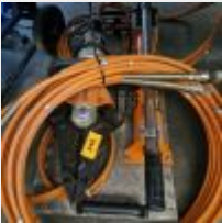
Lot n° 248 Pince hydraulique HOMALTO Mise à prix : 450€ TVA non récupérable