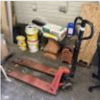
Lot n° 251.1 2 Transpalettes (1 avec 1 roue gripper, 1 avec pb avant plié) Mise à prix : 50€ TVA non récupérable Vendus par la SVV ADJUGE, frais de vente 24%TTC