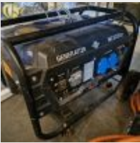
Lot n° 247 Groupe électrogène GENERATOR MC3200 (lanceur cassé) Mise à prix : 150€ TVA non récupérable