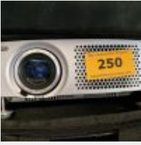
Lot n° 250 Rétroprojecteur SANYO (dans sa saccoche) Mise à prix : 30€ TVA non récupérable