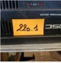
Lot n° 220.1 3 Amplificateurs QSC ISA BOOTI Mise à prix : 150€ TVA non récupérable