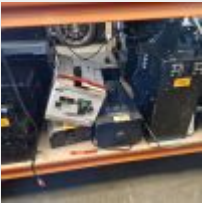
Lot n° 223 Machine à fumée CHAUVET Machine à fumée NOVISTAR Machine à jet de flamme FLAMANDFIRE (avec cartouche de gaz) 2 Lasers SCAN CONTEST Mise à prix : 80€ TVA non récupérable