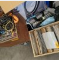
Lot n° 222 Vinyles de styles différents (environ 350) 3 Flightcases pour vinyles 2 Caisses bois Mise à prix : 350€ TVA non récupérable