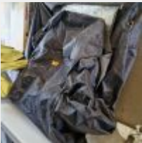
Lot n° 252 Chambre de pousse armature tubulaire plastique 2 Paravents Mise à prix : 20€ TVA non récupérable