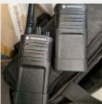
Lot n° 249 2 Talkie Walkie Mise à prix : 10€ TVA non récupérable