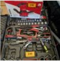
Lot n° 246 Ponceuse excentrique INVENTIV Malette d'outils Mise à prix : 50€ TVA non récupérable