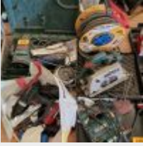
Lot n° 245 Ponceuse orbitale BOSCH Scie circulaire BOSCH Scie sauteuse PARKSIDE Visseuse PARKSIDE avec chargeur, accu, multimètre Enrouleur grosse section 25M Mise à prix : 80€ TVA non récupérable