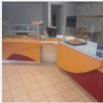
Lot n° 2 Aménagement de magasin comprenant : - 1 Vitrine en 2 parties (environ 180 cm), 3 Plaques inox (groupe dans le passage, le long de la maison) - A démonter par un professionnel habilité - 1 Vitrine sèche (environ 120cm) - 1 Plan de travail - 1 Caisse (Environ 5 m, en linéaire avec décrochement) 33334€ TTC, 9/2011 Mise à prix : 2000€