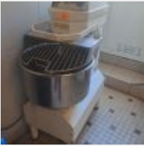
Lot n° 32 Spirale SPISOR PHEBUS cuve 20 Litres inox (fonctionne), n°109135 Mise à prix : 400€