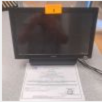
Lot n° 1 Caisse CASIO VR7000 écran tactile commerçant et écran client avec onduleur NITRAM, Imprimante ticket CASO Fournisseur BURELEC, 2017 3388€ TTC Mise à prix : 250€