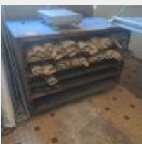
Lot n° 35 Machine repose pâton cassé, démontée Parisien en bois et couches Mise à prix : 50€