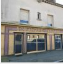
Lot n° 0