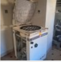
Lot n° 31 Diviseuse MERAND DC20 (fonctionne) Mise à prix : 200€