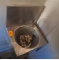
Lot n° 30 Lave-mains inox - (A démonter sans endommager le local) Poubelle Mise à prix : 40€