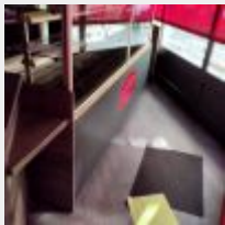
Lot n° 3 Vitrine réfrigérée positive, groupe sur le toit, environ 90cm de large et 2m60 de long (Sort démontée par la porte automatique) A démonter par un professionnel habilité Se trouvant à RENNES Mise à prix : 400€ Vendu sur désignation Exposition le 14 avril de 9h30 à 10h, 42 rue Saint Georges à RENNES Enlèvement le 22 avril à 15h Suite LJS SARL CG, à la requête du TC de RENNES, Me BRILLAUD MJ