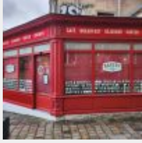
Lot n° 0