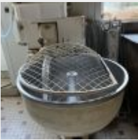
Lot n° 33 Pétrin cuve alu, 60 Litres Mise à prix : 100€