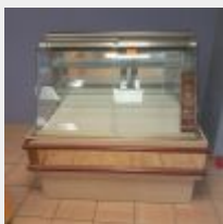
Lot n° 4 Vitrine à chocolat, groupe logé, sur roues MERAND (NOYAL), 2 portes coulissantes en verre bombé Mise à prix : 200€