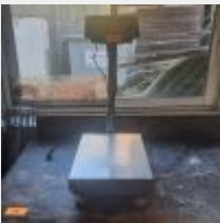
Lot n° 34 Balance TSX MF Mise à prix : 50€