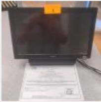
Lot n° 1 Caisse CASIO VR7000 écran tactile commerçant et écran client avec onduleur NITRAM, Imprimante ticket CASO Fournisseur BURELEC, 2017 3388€ TTC Mise à prix : 250€