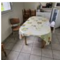
Table oblongue, 10 Chaises dépareillées, Réfrigérateur, Micro ondes, 3 Machines à café Mise à prix : 40€

2 Bureaux avec retour, 2 Caissons, 2 Fauteuils de direction, Petite imprimante EPSON Mise à prix : 150€