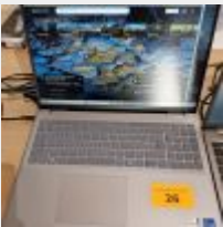
Lot n° 26 Ordinateur portable DELL Inspiron Intel core i5 iris x, avec alimentation, Mdp : 123540 Mise à prix : 100 €