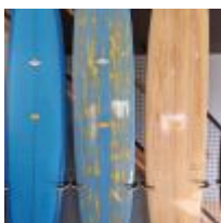
Planche de surf MD bleu/effet or avec son support (L : 277cm - planche unique) Mise à prix : 300 €