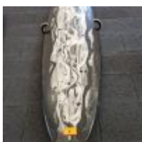
Planche de surf MD bleu pailleté avec support mural (L : 204cm) Planche de surf MD bleu/effet rose avec support mural (L : 180cm) Mise à prix : 150 €