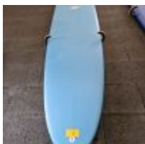
Planche de surf MD bleu avec support mural (L : 264cm) Mise à prix : 150 €

Planche de surf MD bleu/effet rose avec support mural (L : 180cm) Mise à prix : 150 €