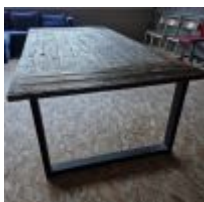
Table en bois Mise à prix : 100€

Etuve artisanale en bois Mise à prix : 100€