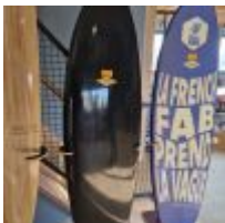
Planche de Surf MD black avec feuille d'or, avec son support (L : 193cm) Mise à prix : 300 €