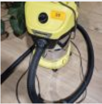
Lot n° 20 4 Caissons, Siège de bureau, Aspirateur Mise à prix : 70 €