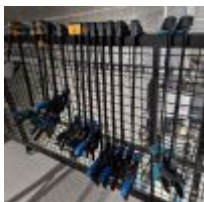
Table sur roulettes Mise à prix : 20 €