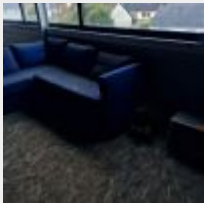
Lot n° 54 6 Chaises d'écolier, Micro-ondes, Chaise sur roulettes, Canapé d'angle Mise à prix : 50€