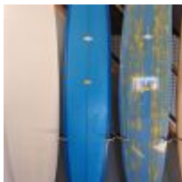
Planche de surf MD bleu/effet or avec son support (L : 277cm - planche unique) Mise à prix : 300 €