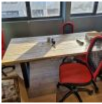
Table rectangulaire plateau bois piétement métal, 5 Sièges sur roulettes, Paperboard, Carton de fournitures Mise à prix : 100 €