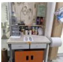
Table haute, Armoire MAGNUSSON garnie de peinture Mise à prix : 50€