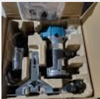
Lot n° 55 Affleureuse KATSU neuve Mise à prix : 40€