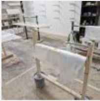
Lot n° 47 Lot de produits entamés, 4 Chevalets, Résine et fibre, 4 Supports de planche Mise à prix : 50€