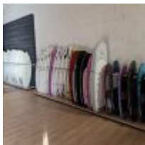
Planche de surf MD jaune avec support mural (L : 278cm) Mise à prix : 150 €