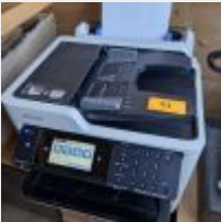
Lot n° 21 Multifonction EPSON workforce pro WF. C5790, scanette, imprimante EPSON Mise à prix : 50 €