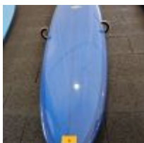
Planche de surf MD bleu pailleté avec support mural (L : 204cm) Planche de surf MD bleu/effet rose avec support mural (L : 180cm) Mise à prix : 150 €

Planche de surf MD bleu avec support mural (L : 264cm) Mise à prix : 150 €