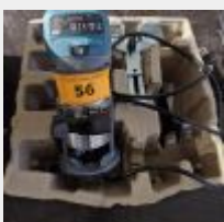
Lot n° 56 Affleureuse KATSU Mise à prix : 30€