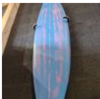
Planche de surf MD bleu deux tons avec son support (L : 280cm - Planche unique) Mise à prix : 300 €