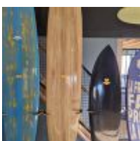
Planche de surf "The Gem Timbertek" avec son support (L : 285cm) Mise à prix : 150 €

Planche de Surf MD black avec feuille d'or, avec son support (L : 193cm) Mise à prix : 300 €