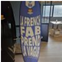
Planche de Surf MD "La French Fab prend la vague" avec son support (L : 188cm) Mise à prix : 300 €