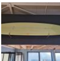
Planche de surf MD jaune avec support mural (L : 278cm) Mise à prix : 150 €