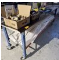
Table sur roulettes Mise à prix : 20 €