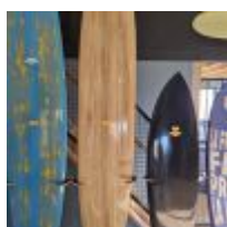
Planche de Surf MD black avec feuille d'or, avec son support (L : 193cm) Mise à prix : 300 €