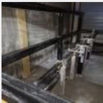
Lot n° 49 Fraiseuse CNC Tech KM System 4 axes, 2021 Financée 63 492€ (facture sur demande à l'étude) Mise à prix : 8000€ Vendue par la SVV ADJUGE, à la requête d'un établissement financier, Frais de vente 24% TTC