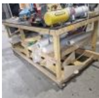
Table roulante de préparation en bois avec 4 tréteaux Mise à prix : 50€

Lot de produits entamés (la plupart pas utilisable), 4 Chevalets, Résine et fibre, 4 Supports de planche Mise à prix : 50€