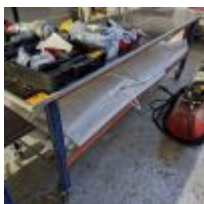
Table sur roulettes Mise à prix : 20 €