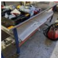
Table sur roulettes Mise à prix : 20 €