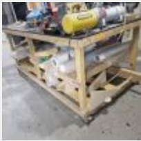
Lot n° 48 Table roulante de préparation en bois avec 4 tréteaux Mise à prix : 50€