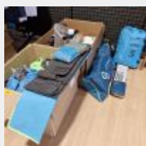
Lot n° 16 Lot comprenant 25 pièces dont 4 voiles Wings, 2 gonfleurs, housse de protection, baudrier, accessoires Mise à prix : 150 €