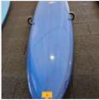
Lot n° 8 Planche de surf MD bleu pailleté avec support mural (L : 204cm) Planche de surf MD bleu/effet rose avec support mural (L : 180cm) Mise à prix : 150 €