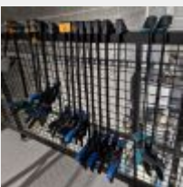
Lot n° 74 29 Serre-joints, 2 Tréteaux réglables métalliques Mise à prix : 250 €