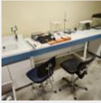
Lot n° 85 3 Paillasses, tabouret Mise à prix : 300 €