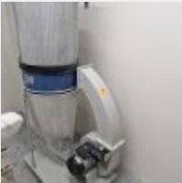
Lot n° 43 Aspiration HBM 200 PROFI, 2021, 230V Mise à prix : 100€