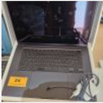
Lot n° 24 Macbook air 15 pouces 8GB memory 256GB SSD avec alimentation Mdp : Cutback03042023h Mise à prix : 250 €