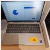
Lot n° 25 Ordinateur portable DELL Installation Intel Core ultra 7, avec alimentation, réinitialisé Mise à prix : 100 €