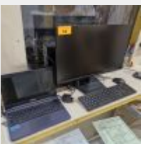
Lot n° 50 Ordinateur portable ASUS avec alimentation Mdp : 0327 Ordinateur ESSENTIEL avec unité centrale Mdp : 0327 Mise à prix : 80€