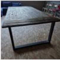
Lot n° 53 Table en bois Mise à prix : 100€