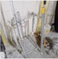
Lot n° 41.1 Porte-fût Mise à prix : 50€