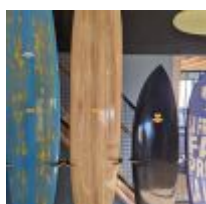
Planche de surf "The Gem Timbertek" avec son support (L : 285cm) Mise à prix : 150 €

Planche de Surf MD black avec feuille d'or, avec son support (L : 193cm) Mise à prix : 300 €