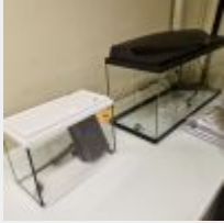
Lot n° 86 2 Aquariums Mise à prix : 30 €