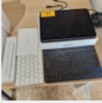
Lot n° 23 Ipad pro 11, 256GB, 2021, avec 2 claviers, 1 stylet sans alimentation, avec cordons Mdp : 123540 Mise à prix : 100 €