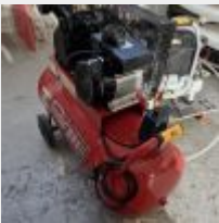
Lot n° 61 Compresseur HS Mise à prix : 20 €