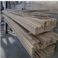
Lot n° 67 Lot de bois (lattes, feuilles de contreplaqué) Mise à prix : 100€