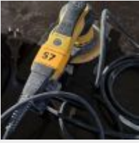
Lot n° 57 Ponceuse MIRKA Mise à prix : 30€