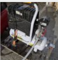
Lot n° 62 Pompe à vide BILTEC 080 Mise à prix : 50€