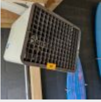
Lot n° 18 2 Aérothermes, à décabler proprement avec WAGO ou dominos obligatoires Mise à prix : 400€