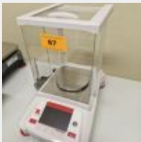
Lot n° 87 Balance précision OHAUS AX 623 Achetée 2 139 €TTC Mise à prix : 150 €