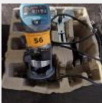
Lot n° 56 Affleureuse KATSU Mise à prix : 30€