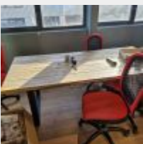
Lot n° 22 Table rectangulaire plateau bois piétement métal, 5 Sièges sur roulettes, Paperboard, Carton de fournitures Mise à prix : 100 €