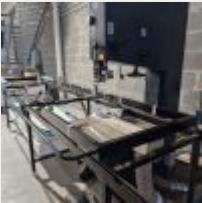
Lot n° 65 Scie à ruban FELDER FB 710, 2024, longueur de lame 5120mm, 5.5kw avec banc de guidage (fait sur mesure par Carlo Métallerie à ST MALO) avec aspiration FELDER AF 14 Mise à prix : 3000€