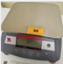
Lot n° 88 Balance OHAUS ranger 3000 Mise à prix : 50 €