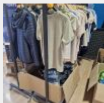
Lot n° 15 Environ 136 Vêtements dont environ : - 60 tee-shirts (Prix de vente : 35€) - 3 blousons (Prix de vente : 100€) - 9 sweats à capuche (Prix de vente : 80€ à 130€) - 17 sorties de bain / ponchos (prix de vente : 50 à 65€) - 3 casquettes, bob, 5 bonnets (prix de vente : 30€) - 10 bermudas (prix de vente : 60€) Prix de vente estimé : 5000 à 6000€ Mise à prix : 800 €