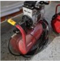
Lot n° 60 Petit compresseur 50L Mise à prix : 80€