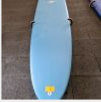
Lot n° 7 Planche de surf MD bleu avec support mural (L : 264cm) Mise à prix : 150 €