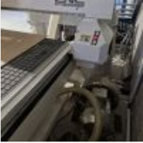
Lot n° 64 Fraiseuse CNC 3060 bois avec pupitre L6000 / 3000 avec aspirations 2 sacs, avec pompe ride CW3000 et pupitre de commande (Cellule10) Mise à prix : 5000€