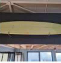
Planche de surf MD jaune avec support mural (L : 278cm) Mise à prix : 150 €