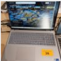
Lot n° 26 Ordinateur portable DELL Inspiron Intel core i5 iris x, avec alimentation, Mdp : 123540 Mise à prix : 100 €