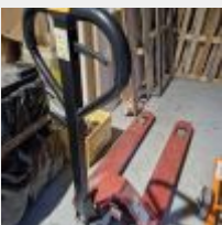
Lot n° 68 Transpalette 2.5 T Mise à prix : 120€