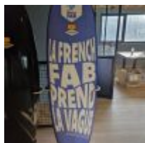
Planche de Surf MD "La French Fab prend la vague" avec son support (L : 188cm) Mise à prix : 300 €