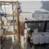
Lot n° 66 Etagères galva, Petit bureau, 2 Etagères bois garnies de consommable (abrasifs, bandes cache, et divers produits entamés) Mise à prix : 50€