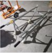
Lot n° 70.1 Porte-fût Mise à prix : 20 €