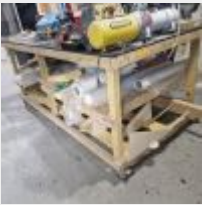
Lot n° 48 Table roulante de préparation en bois avec 4 tréteaux Mise à prix : 50€