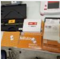
Lot n° 89 Duromètre RS Accessoires (thermohygro TESTO, enregistreur TESTO, autres accessoires) Micromètre, pied à coulisse, câbles MITUTOYO Mise à prix : 80 €