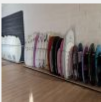
Lot n° 11 Environ 60 Planches MD de test MD et Pro riders déjà surfés dont environ 20 neuves (4 présentées au mur) Prix de revient à titre indicatif : 20 000€ TTC Mise à prix : 3 000 €