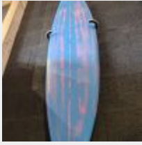
Lot n° 6 Planche de surf MD bleu/effet rose avec support mural (L : 180cm) Mise à prix : 150 €