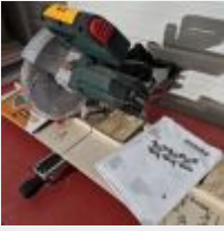
Lot n° 63 Scie pendulaire METABO KGS 216M avec 1 lame, 03/2023 Mise à prix : 80€