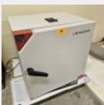
Lot n° 90 Étuve Drying and Heating chamber Solid.line FDS 56 (1 524.24 € TTC) Mise à prix : 350 €