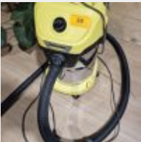
Lot n° 20 4 Caissons, Siège de bureau, Aspirateur Mise à prix : 70 €