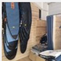
Lot n° 12 Environ 41 Housses de planches de différentes tailles Mise à prix : 300 €