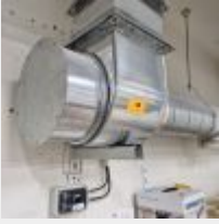
Lot n° 46 Turbine d'aspiration basse ronde avec variateur Mise à prix : 150€