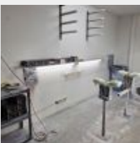
Lot n° 44 8 Supports de planche, 2 Chevalets de planche, 2 Etagères PVS, Boîte d'abrasifs Mise à prix : 100€