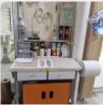
Lot n° 42 Table haute, Armoire MAGNUSSON garnie de peinture Mise à prix : 50€