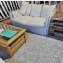
Lot n° 19 2 Canapés en tissu, Table basse, Tapis, 2 Présentoirs palettes sur roulettes, Plantes Mise à prix : 200 €