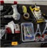
Lot n° 59 Boîte de laser LEICA, Boîte d'embouts, Sèche-cheveux, 2 Pincés lève-panneaux, Petit outillage Mise à prix : 50€