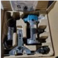
Lot n° 55 Affleureuse KATSU neuve Mise à prix : 40€