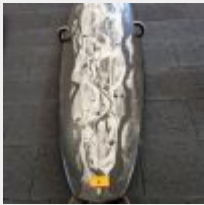
Lot n° 9 Planche de surf MD noir/blanc avec support mural (L : 183cm) Mise à prix : 150 €