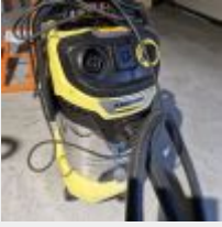
Lot n° 70 Aspirateur KARCHER WD6PS Mise à prix : 20 €