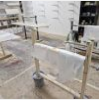
Lot n° 47 Lot de produits entamés, 4 Chevalets, Résine et fibre, 4 Supports de planche Mise à prix : 50€