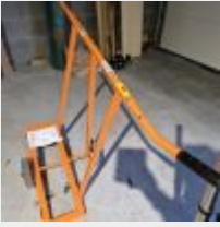
Lot n° 69 Chariot porte panneau Mise à prix : 30 €