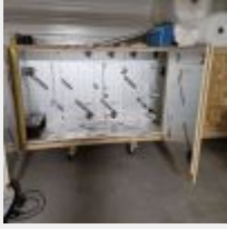
Lot n° 52 Etuve artisanale en bois Mise à prix : 100€