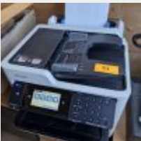
Lot n° 21 Multifonction EPSON workforce pro WF. C5790, scanette, imprimante EPSON Mise à prix : 50 €