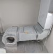
Lot n° 45 Turbine d'aspiration en galva rectangulaire avec variateur Mise à prix : 200€