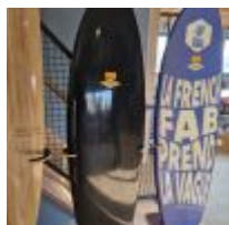
Planche de Surf MD black avec feuille d'or, avec son support (L : 193cm) Mise à prix : 300 €