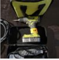
Lot n° 58 DREMEL, Visseuse RYOBI, 2 accus, 1 chargeur Mise à prix : 50€