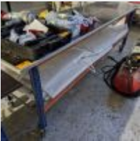
Lot n° 72 Table sur roulettes Mise à prix : 20 €