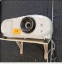
Lot n° 17 Vidéo-projecteur 3 LCD avec télécommande Mise à prix : 100€