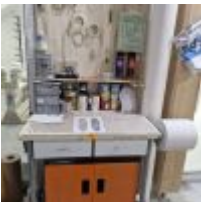
Table haute, Armoire MAGNUSSON garnie de peinture Mise à prix : 50€