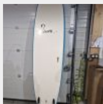
Lot n° 11.1 Planche mousse prototype école Mise à prix : 100€