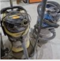
Lot n° 41 2 Aspirateurs dont 1 KARCHER Mise à prix : 50€