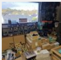
Lot n° 13 Lot d'accessoires comprenant environ 147 dérives, 126 pièces (gants et accessoires), 69 pièces (cagoules, chaussons, gants), 7 Cartons de Wax et Punt, 2 Cartons de nettoyant de combinaison, 120 Pièces sur le comptoir (crème solaire, sticks solaires, accessoires) Prix achat : 18 199€ TTC (à titre indicatif) Liste détaillée chiffrée par l'entreprise, à titre indicatif, sur demande à l'étude Mise à prix : 1 000 €