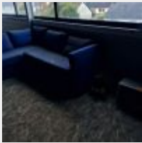
Lot n° 54 6 Chaises d'écolier, Micro-ondes, Chaise sur roulettes, Canapé d'angle Mise à prix : 50€