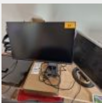
Lot n° 27 Ecran DELL 24 avec station d'accueil DELL WD19S Ecran PHILIPS avec télécommande, écran HANNES G Mise à prix : 30 €