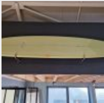
Lot n° 10 Planche de surf MD jaune avec support mural (L : 278cm) Mise à prix : 150 €