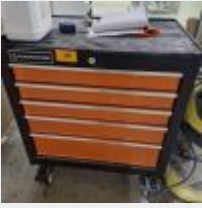
Lot n° 40 Servante MAGNUSSON garnie Mise à prix : 50€