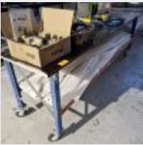
Lot n° 71 Table sur roulettes Mise à prix : 20 €