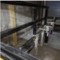
Lot n° 49 Fraiseuse CNC Tech KM System 4 axes, 2021 Financée 63 492€ (facture sur demande à l'étude) Mise à prix : 8000€ Vendue par la SVV ADJUGE, à la requête d'un établissement financier, Frais de vente 24% TTC