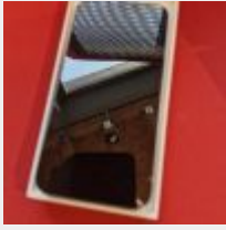
Lot n° 22.1 Iphone 13 Mise à prix : 100 €