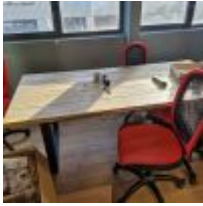
Table rectangulaire plateau bois piétement métal, 5 Sièges sur roulettes, Paperboard, Carton de fournitures Mise à prix : 100 €