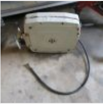
Lot n° 47 Dérouleuse de tuyau d'huile, manque le pistolet