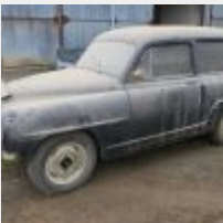
Lot n° 8 1954-YM-35 TISVOL 9