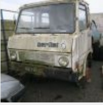
Lot n° 28 4917-RT-35 BERLIET