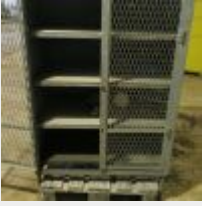
Lot n° 52 Armoire métal 2 portes grillagées 4 niveaux