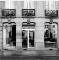
Lot n° 48 Lève boîte DESVIL hydraulique (avec accessoire)