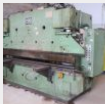
Lot n° 65 Presse plieuse PDG COMESSA 120 tonnes en 3 mètres, année 1979, type PNS 100, numéro 2617 Fuite de 2 vérins, tuyau hydraulique au dessus de la plieuse tordu au déchargement, un poinçon marqué