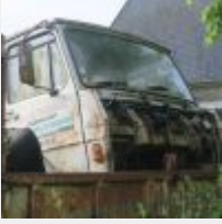
Lot n° 16 4128-RR-35 BERLLIER