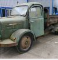
Lot n° 15 402-DA-44 HOTCHKISS . PL25