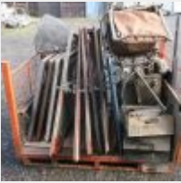
Lot n° 53 Lot de pièce HY comprenant 3 calandres, 6 portes, 2 sièges, un capot moteur, 3 boites à gants métalliques, lot de portes arriere basses, sans le bac métal