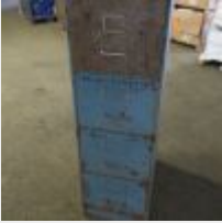
Lot n° 34 Classeur métal 4 tiroirs