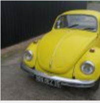
Lot n° 33 886-BEZ-35 VOLKSWAGEN COCCINELLE