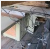
Lot n° 61 Scie à format MINI MAX modèle SC3, année 1997 no KK.036998 380 Volts