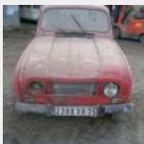
Lot n° 3 2388-XH-35 RENAULT 4L