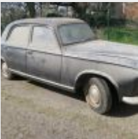
Lot n° 7 935-HC-35 PEUGEOT 403