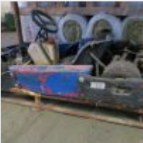
Lot n° 25 Karting SODIKART FUN