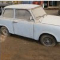
Lot n° 6 242-GJ-41 . TRABANT 601