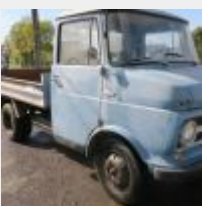
Lot n° 20 AR-304-FS OPEL BLITZ1900