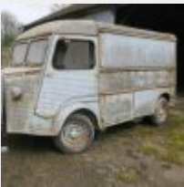
Lot n° 11 351-CG-53 CITROEN TYPE H