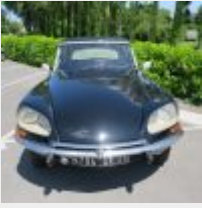
Lot n° 10 4794-SX-35 CITROEN