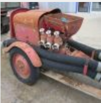
Lot n° 13 Pompe GUINARD, manque divers pièces moteur (culasse, cache culasse échappement) Sous reserve d'autres pièces manquantes