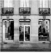
Lot n° 51 Armoire métal 2 niveaux jaune