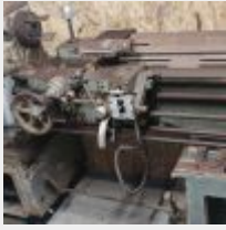
Lot n° 69 Tour à métaux EMAULT SOMUA, à restaurer, vis mère filetage