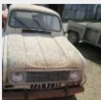
Lot n° 1 725-VJ-35 RENAULT 4L