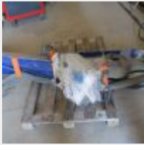
Lot n° 41 Potence murale AIRCO avec système d'aspiration deux postes, déplié 6 mètres, bon état général