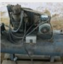
Lot n° 50 Compresseur 200 litres triphasé