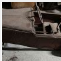
Lot n° 66 Voiture à pédale RENAULT d'avant guerre, à restaurer