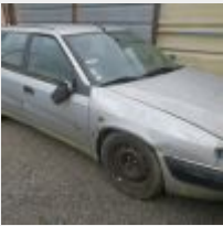
Lot n° 30 871-BET-35 CITROEN XANTIA