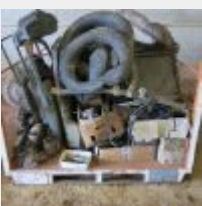
Lot n° 38 Divers pièces comprenant, portes, enjoliveurs, faisceaux électriques, alternateur, jonc chromé, sans la caisse métal