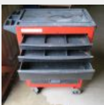
Lot n° 44 Caisse FACOM, bon état général