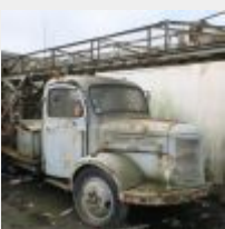
Lot n° 14 895-AW-22 HOTCHKISS . PL25