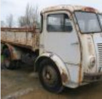
Lot n° 19 912-ON-35 BERLIET