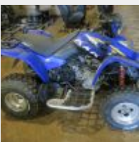
Lot n° 26 136-AFM-35 KYMCO KIMCO 250 KXR