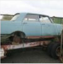
Lot n° 29 404 Verte pour pièces, corrosion perforante, avec boîte de vitesse, sans moteur mais avec le pont arrière, caisse percé au niveau des pieds avant