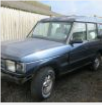
Lot n° 27 876-AHA-29 LAND ROVER DISCOVERY 2 TDI