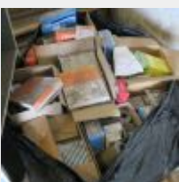
Lot n° 56 Lot de divers filtres