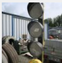
Lot n° 63 Feux tricolores pour décoration