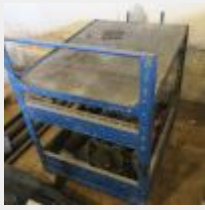
Lot n° 57 Petite servante métal bleu