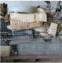
Lot n° 54 lot de pièces HY comprenant, arceau de pick up, rétroviseurs, pare choc, tringlerie essuis glace, amortisseurs, vitres et parebrises, calote d'aile, échappement... Sans le bac métal