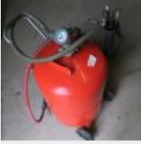
Lot n° 46 Récupérateur d'huile CLAS avec système d'aspiration