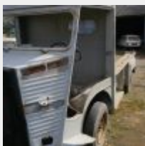
Lot n° 2 CITROEN TYPE HY PICK-UP