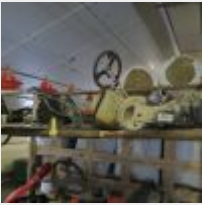
Lot n° 23 Karting sans moteur pour pièces