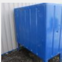
Lot n° 62 2 Cuves pour récupération d'huile, environ 1000 litres