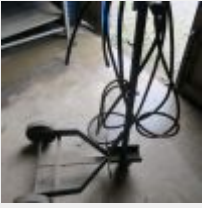
Lot n° 45 Chariot 3 roues, pompe à graisse