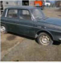
Lot n° 4 674-PS-35 RENAULT 10