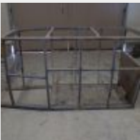
Lot n° 37 Châssis en bois de voiture (PEUGEOT)