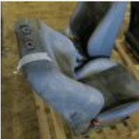
Lot n° 49 Siege de CLIO GORDINI, air bag declenché, volant sans airbag GORDINI, 4 jantes alu RENAULT, un moteur RENAULT diesel DCI et compteur avec son berceau, amortisseur, echappement et cataliseur