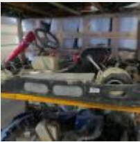
Lot n° 24 Karting 4 temps SODIKART FUN