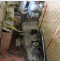
Lot n° 55 Moteur HY avec boîte de vitesse, parebrise sans référence. Sans la caisse métal