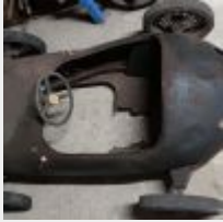
Lot n° 70 Voiture à pédales de course, à restaurer