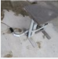
Lot n° 39 Lève motocross