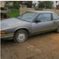
Lot n° 18 BM-067-MA BUNKER