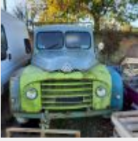
Lot n° 10 249-DJ-23 CITROEN U23