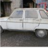
Lot n° 5 4847-RE-35 RENAULT 6