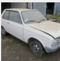
Lot n° 0 3154-VV-44 PEUGEOT 104 Z