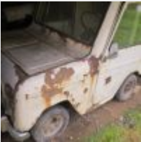
Lot n° 31 2 Voiturettes WILLIAM pour pièces