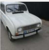
Lot n° 32 BW-833-YT RENAULT 4L CLAN