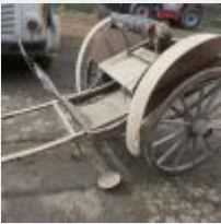
Lot n° 12 Charrette pour chevaux, roue droite dure a tourner, sellerie a revoir