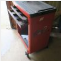
Lot n° 43 Caisse FACOM incomplete, manque les tiroirs