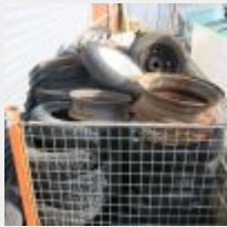
Lot n° 60 Lot de pneus et jantes, sans le casier