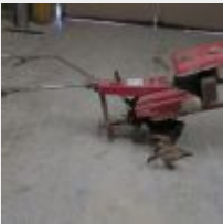
Lot n° 36 Moto bineuse BOYER 334-70