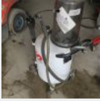
Lot n° 40 Récupérateur d'huile SAMAO, capacité 65 litres avec système aspirant, bon état général