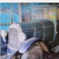
Lot n° 9 477-ZC-92 CITROEN B14