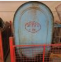
Lot n° 35 Cuve à fioul SUPRA 600 litres