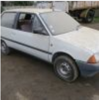
Lot n° 17 BD-213-DQ CITROEN AX 14 TRS