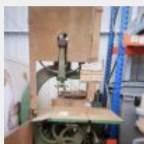
Lot n° 68 Scie à ruban avec affuteuse de lame Mise à prix: 350€