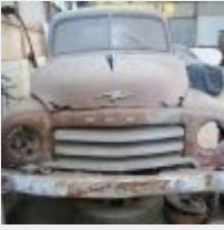
Lot n° 21 OPEL BLITZ