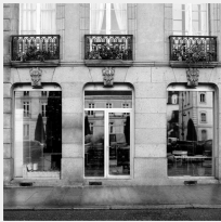
Lot n° 42 Equilibreuse DEFITEC (DEFPRO8000) Fonctionne, avec accessoire