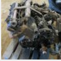
Lot n° 58 Moteur d'estafette RENAULT