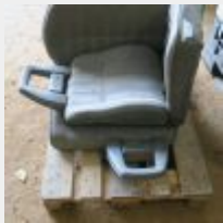
Lot n° 59 2 Sièges de NISSAN PATROL pick up état moyen