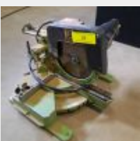
Lot n° 18 Scie circulaire sur table ELECTRO BECKUM (manque un cartère, fonctionne) Mise à prix : 50€