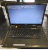
Lot n° 7 PC portable TOSHIBA SATELLITE L555 10U (remis à 0) Mise à prix : 40€