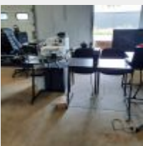
Lot n° 12 2 Bureaux d'angle noirs + Caisson + Fauteuil de direction + 2 Chaises visiteurs + Poubelle + Fourniture de bureau Mise à prix : 20€