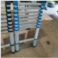
Lot n° 4 Echelle télescopique Mise à prix : 20€