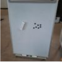
Lot n° 14 Paperboard Mise à prix : 10€