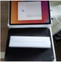
Lot n° 9 iPad Pro 64GB, avec chargeur, stylet et protection (avec boitage) Mise à prix : 500 €