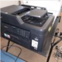
Lot n° 15 Imprimante BROTHER MFC-J5335DW (testé le 19 08 21) Mise à prix : 20€