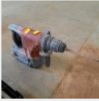
Lot n° 1 Perforateur HILTI TE6A (1 accu, pas de chargeur, fonctionne le 5 juillet) Mise à prix : 40€