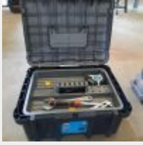
Lot n° 2 Caisse à outils garnie de marteaux, pinces, clés ... Mise à prix : 5€