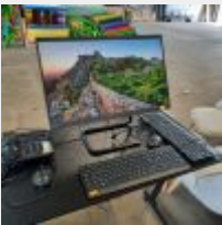
Lot n° 11 PC fixe tour intégrée LENOVO FOE7 n°MP1N8XM8 Pentium silver + 2 Claviers + 2 Souris + Téléphone BOULANGER + Multifonction CANON PIXMA TS3351 Mise à prix : 150€