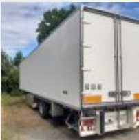
Lot n° 16 VENDU SUR DESIGNATION (Matériel à prendre à CHAUVIGNE, sur plateau) Semi remorque FRUEHAUF frigo 3 essieux, groupe Thermoking DMC : 27/10/1999 Immatriculation : AQ-996-ZQ Non roulante, servait de stockage, manque 4 pneus sur deux essieux. Groupe frigo HS et fuites d'eau par le toit (n'est plus étanche) Mise à prix : 300€