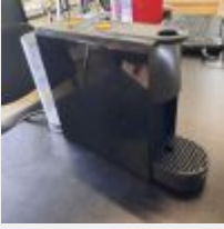
Lot n° 8 Machine à café NESPRESSO KRUPS Mise à prix : 15€