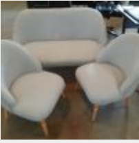
Lot n° 13 Banquette + Paire de fauteuils crapaud tissu beige Mise à prix : 30€