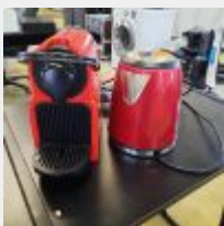
Lot n° 6 Machine à café KRUPS NESPRESSO + Bouilloire ELECTROLUX Mise à prix : 30€