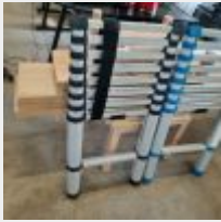
Lot n° 3 Echelle télescopique noire Mise à prix : 20€