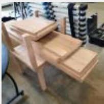
Lot n° 5 2 Tables basses + Etagère à cases démontée Mise à prix : 20€