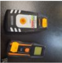
Lot n° 10 Hygromètre + Lasermètre Mise à prix : 10€