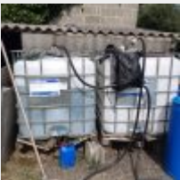
Lot n° 17 VENDU SUR DESIGNATION (Matériel à prendre à CHAUVIGNE) Deux cuves plastique 1000 litres chacune pour liquide Ad Blue avec un pistolet distributeur électrique (Une cuve vide et une cuve avec de l'Ad Blue) Mise à prix : 80€