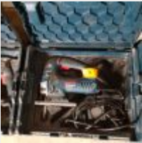
Lot n° 5 Scie sauteuse BOSCH PRO filaire GST 150 BCE Mise à prix : 20€