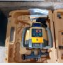
Lot n° 9 Laser TOPCON RL H5A avec chargeur et télécommande Mise à prix : 80€