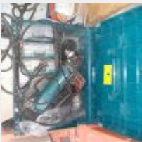
Lot n° 7 Multifonction MAKITA TM3010C filaire Mise à prix : 40€