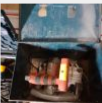
Lot n° 8 Scie plongeant REDSTONE filaire avec son guide dans une boite BOSCH Mise à prix : 50€