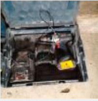
Lot n° 1 Visseuse BOSCH PRO GSR 18 VE 24, 1 accu et 1 chargeur Mise à prix : 40€