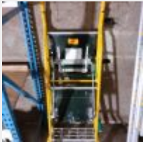
Lot n° 20 Escabeau MACC Mise à prix : 40€