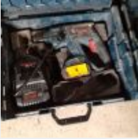
Lot n° 3 Marteau perfo BOSCH PRO GBH 18V EC, 1 accu et 1 chargeur Mise à prix : 50€