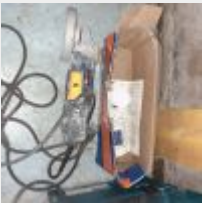
Lot n° 6 Meuleuse BOSCH PRO filaire GST 150 BCE Mise à prix : 20€