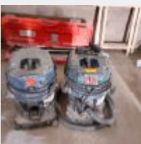
Lot n° 14 2 Aspirateurs BOSCH PRO GAS 35L AFC (manque 1 tuyau et 1 manche) Mise à prix : 60€