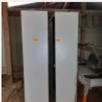
Lot n° 32 2 Armoires métal Mise à prix : 40€