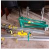
Lot n° 18 Lève plaque MACC Mise à prix : 100€