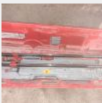
Lot n° 21 Carrelette RUBI TX900 Mise à prix : 80€