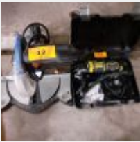
Lot n° 12 Scie à coupe d'onglet DEXTER MS8 filaire Multifonction STANLEY FATMAX Petit compresseur Mise à prix : 100€