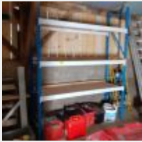
Lot n° 27 Etagère sur cornières métal rouge 4 niveaux Etagère galva 4 niveaux Petit rack 3 niveaux Mise à prix : 60€