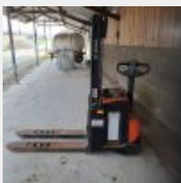
Lot n° 33 Transpalette électrique BT STAXIO 1.40m (Achat AXXEL en crédit bail), 1600 Kg avec chargeur Mise à prix : 400€