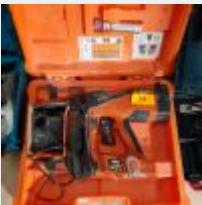
Lot n° 13 Cloueur SPIT 800P + PULSA avec chargeur Mise à prix : 150€