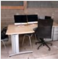
Lot n° 31 Bureau, petit meuble 2 portes, caisson, 2 chaises coque visiteur Bureau d'angle avec 2 caissons SAMAS, 1 siège sur roulettes, 2 chaises coque Mise à prix : 40€