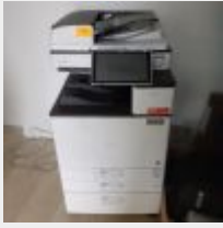
Lot n° 34 Photocopieur RICOH MPC 2004ex A confirmer