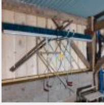
Lot n° 24 5 Barres à chape liquide, 5 Tréteaux, 1 Sauterelle, 4 Seaux à colle, 2 Jericanes, Seaux, Pelle, Gratoir, 2 Balais, 2 Bacs de pige pour niveau, Enrouleur avec tuyau, 4 Bidons de produit pour chape liquide SIKA, Joint de dilatation, Equerre d'angle Mise à prix : 150€