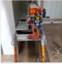
Lot n° 23 Scie Mise à prix : 30€