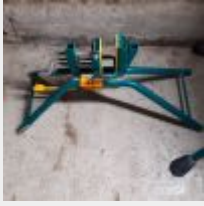
Lot n° 17 Cale porte MACC Mise à prix : 40€