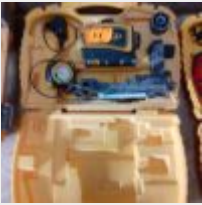
Lot n° 11 Laser SPECTRA PRECISION LT56 avec chargeur Mise à prix : 100€