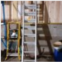
Lot n° 19 Echelle 2 brins MACC Echelle double 2 Brins d'échelle Mise à prix : 150€