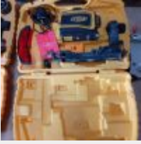
Lot n° 10 Laser SPECTRA PRECISION LT56 avec chargeur Mise à prix : 100€