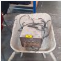
Lot n° 57 Poste à souder à l'arc SUPERGYS 3200S dans sa brouette Mise à prix : 80€