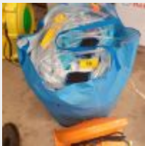
Lot n° 20 2 Châteaux gonflables : Structures avec jets d'eau, les 2 en état dont 1 tâché (879.99 € TTC) Mise à prix : 80€