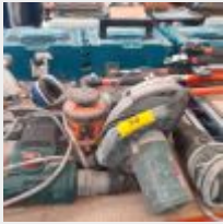
Lot n° 56 Perforateur PARKSIDE, laser OETO, tronçonneuse à bois ECHO, thermique 1983, 2 Scies circulaires, 2 Règles alu, 2 Meuleuses, Perforateur MAKITA, Mise à prix : 50€