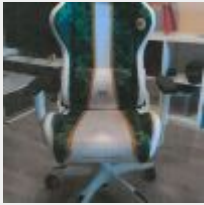
Lot n° 18 Fauteuil de bureau "DIABLO CRAFT" Balance FW MASE 30 Kg min 200g (achetée chez METRO il y a 4 ans, environ 480 euros TTC) 2 Organiseurs métal de bureau Mise à prix : 40€