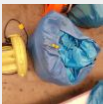
Lot n° 21 Château fort gonflable, structure «Inflatable bed» : (324.99 € TTC) Mise à prix : 30€