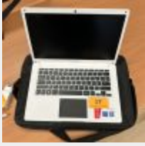
Lot n° 17 PC portable THOMSON Windows 10 Intel Céléron + 1 Sacoche et souris Mise à prix : 50€