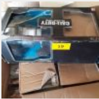
Lot n° 19 Sur une palette : DVD, Figurines, Jeux vidéos, Voiture téléguidée CALL OF DUTY, Manette ATARI, Disques durs, Mise à prix : 200€