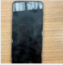
Lot n° 16 Smartphone ONE PLUS 4G, 2017 Mise à prix : 20€