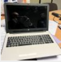
Lot n° 55 Ordinateur portable HP avec alimentation (non testé) Imprimante multifonction HP Mise à prix : 30€