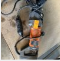
Lot n° 54 Carotteuse filaire orange Mise à prix : 300€