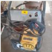
Lot n° 58 Nettoyeur haute pression moteur 196cc sur chariot avec lance Seau d'enduit, moteur démonté SUBARU, 3 Chaises tissus Mise à prix ! 100€