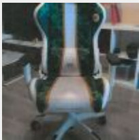
Lot n° 18 Fauteuil de bureau "DIABLO CRAFT" Balance FW MASE 30 Kg min 200g (achetée chez METRO il y a 4 ans, environ 480 euros TTC) 2 Organiseurs métal de bureau Mise à prix : 40€